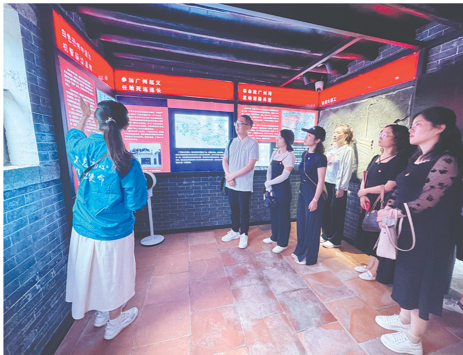
特科在保卫中共中央安全、营救被捕同志、严惩叛徒、搜集情报、配合根据地红军作战等方面，发挥了重要作用。

1927年大革命失败后，中国共产党面临极端危险的境地。面对国民党反动派疯狂的屠杀和破坏，我党决定给予坚决的反击。“成立于1927年11月的中央特科，是我党早期的情报保卫专业机构。在周恩来同志的直接领导下，中央