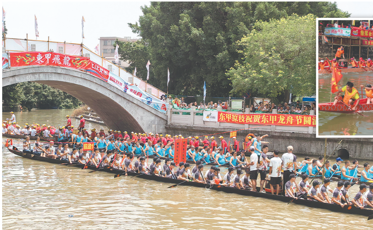
▲每年端午，天马凤艇与龙舟同河竞渡，展现不一样的力与美。