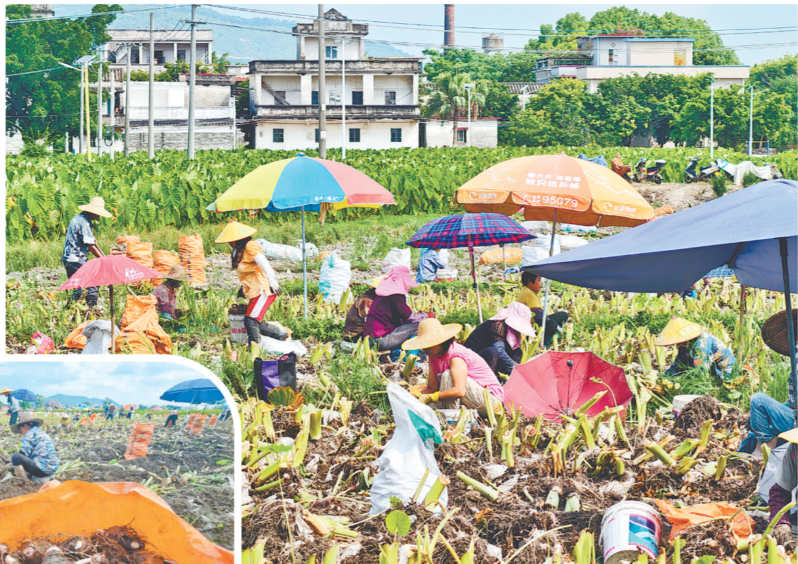
↑农户们在田间地头忙着挖芋头、分拣，一派丰收热闹景象。

开平红芽芋头是当地传统特色农作物，口感粉糯，芋仔纹马凤鸭、番薯芋头煮芥菜、芋头糍等特色食品也广受欢迎。记者了解到，开平芋头产区有月山镇、赤水镇、苍城镇等地，以零星种植和小规模基地为主，近年来逐步扩种，主打红芽芋、槟榔芋、狗爪芋，亩产1500—2500公斤，线下供应珠三角及外地市场，线上通过“阁楼农夫”等品牌外销。