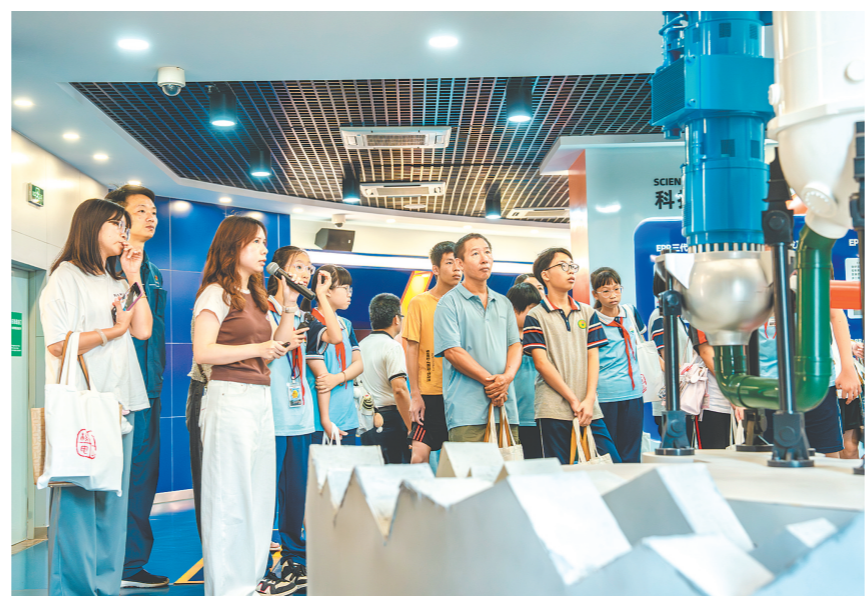
系列活动让生态环境保护理念深入人心。

据了解，今年5月以来，台山核电积极凝聚“政企校”三方生态保护合力，常态化走进社区、深入校园，通过科普宣讲、主题绘画、生态研学等多元化公益活动，持续拓宽生态科普覆盖面，掀起全民守护生物多样性的热潮。