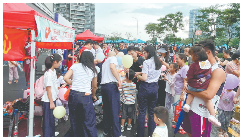
江门农商银行在活动现场设立便民服务摊位,提供便民物资,宣传金融知识。

近日,2026年江门市(蓬江)端午龙舟活动在棠下镇天沙河段(华安路—华盛路)举行。24支龙舟队伍与5万市民齐聚天沙河畔,共襄端午盛举。江门农商银行作为本次活动支持单位,大力支持赛事圆满开展。 比赛现场,桨落舟飞、浪花四溅,沿岸群众呐喊助威,欢呼声、喝彩声此起彼伏,将现场气氛推向顶峰。 赛场之外,江门农商银行的服务身影同样温暖人心。为深入践行“我为群众办实事”实践活动,该行依托党建引领志愿服务体系,组织20余名党员和志愿者在活动现场设立便民服务摊位,为参赛选手、往来市民免费提供饮用水、纸巾、节日气球、艾草驱蚊香囊等便民物资。同时,该行