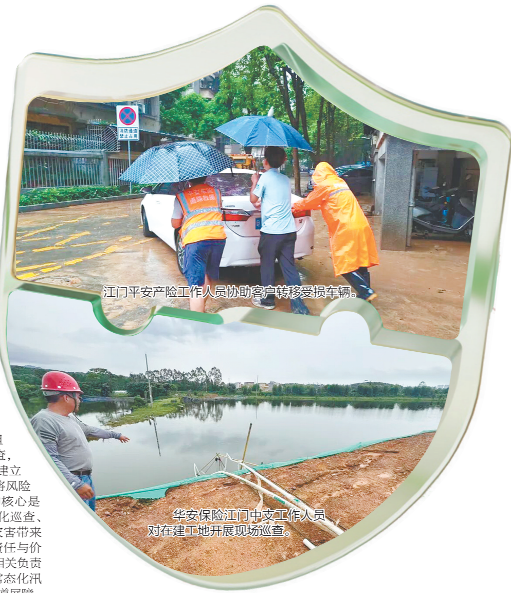
江门平安产险工作人员协助客户转移受淹车辆。

系统、配电设施等重点区域隐患,一对一出具整改方案,普及防汛知识、配送应急物资,助力企业提升自主防灾能力。 华安保险江门中支也聚焦企财险、工程险客户,在6月中旬启动汛期专项回访行动,组建风控小组分片开展全覆盖巡查,重点排查厂区、工地排水隐患,建立隐患台账,实行闭环整改,切实将风险化解在萌芽状态。“汛期防灾的核心是提前预判、精准施策,通过常态化巡查、前置化服务,能最大限度减少灾害带来的财产损失,这是保险行业的责任与价值所在。”江门市保险行业协会相关负责人表示,全市保险机构已形成常态化汛期风控机制,全力筑牢防汛第一道屏障。