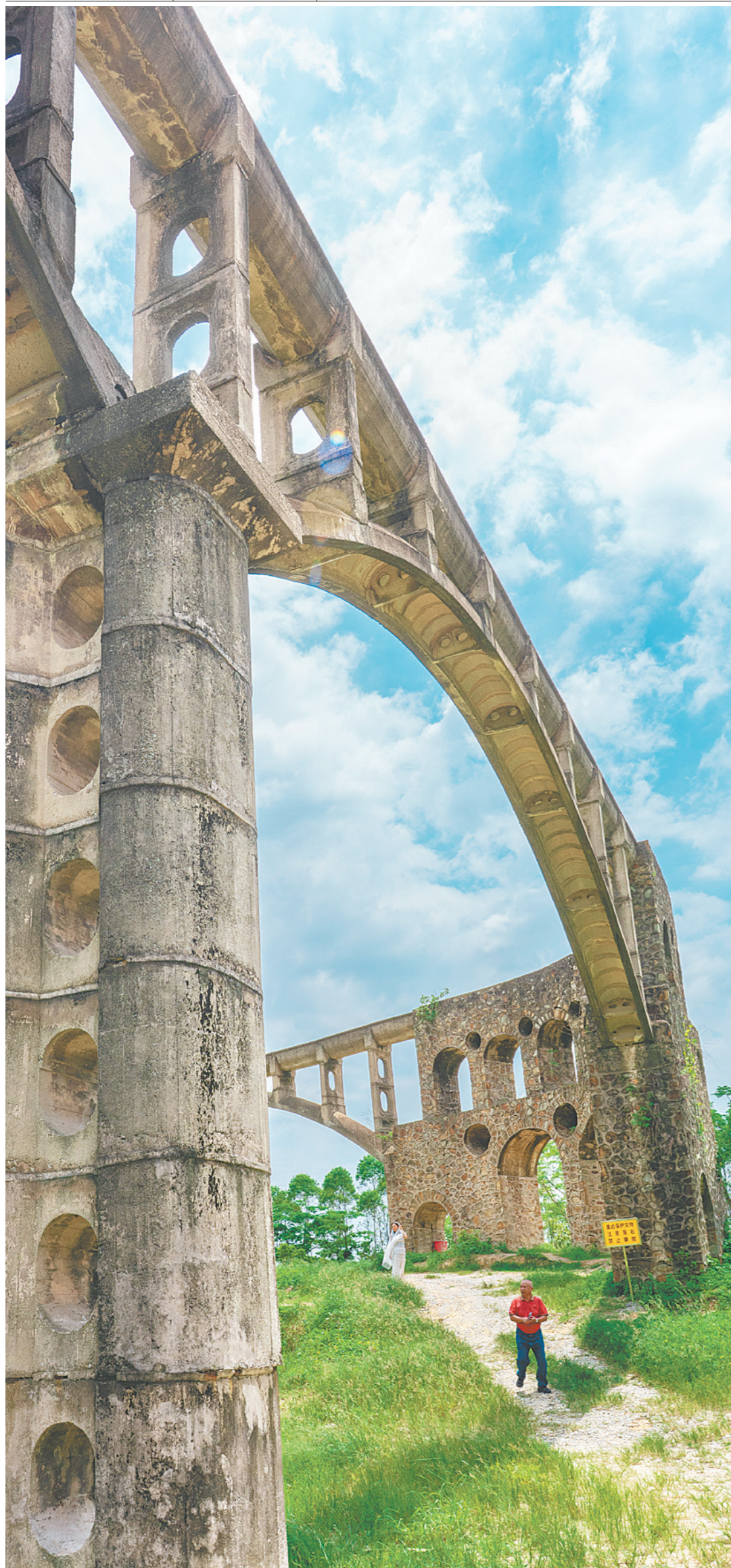
龙口镇通过生态环境整治、步道配套完善，将红旗渠打造为红色研学、乡村文旅打卡节点，以红色文化赋能镇村文旅融合发展。