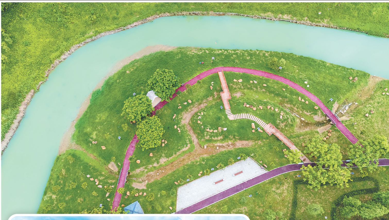
▲龙口镇打造集生态涵养、休闲漫步、观景游憩于一体的龙口湿地公园，实现河道生态修复与群众休闲空间共建共享。