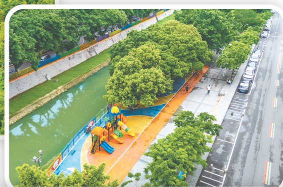
▼龙口镇着力完善亲子休闲娱乐配套设施，提升圩镇生态宜居水平。