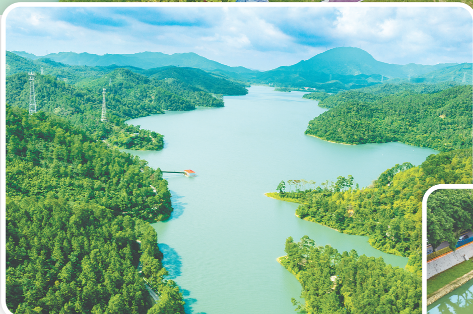
▲四堡水库青山环绕、水体澄澈，森林植被持续优化，筑牢区域饮用水安全屏障。