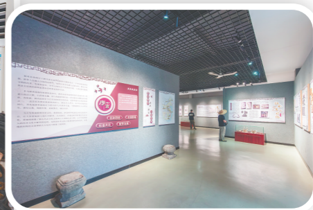
▲全面升级改造的霄南鲜卑古村落文化馆，全方位展现霄南本土发展历程，为游客提供沉浸式乡情研学空间。