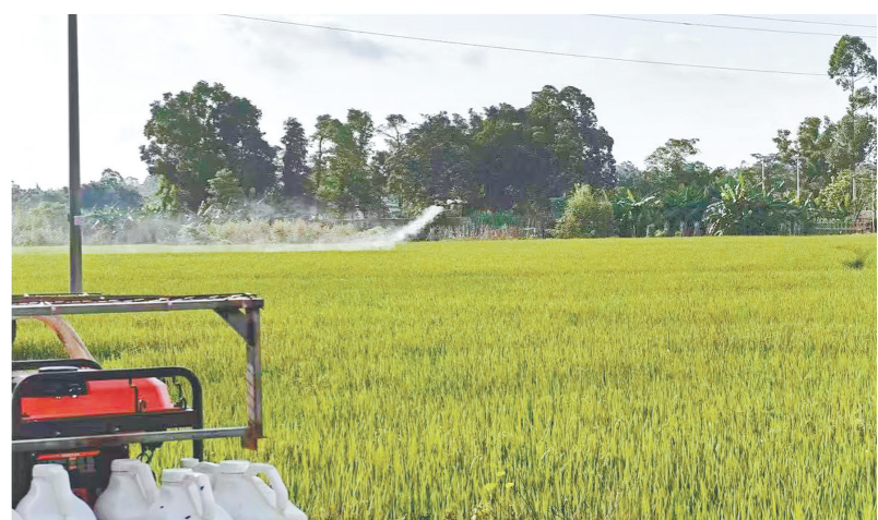
江门人保财险联合相关部门开展灾后无人机飞防作业。

近期江门持续遭遇强降雨天气，正值早稻灌浆成熟关键期，多地稻田积水受淹，水稻病虫害风险陡增。江门人保财险主动靠前落实农业保险“保、防、救、赔”全链条服务，联合农业农村部门开展灾后无人机飞防作业，全力降低农户种植损失，守护本地粮食生产安全。