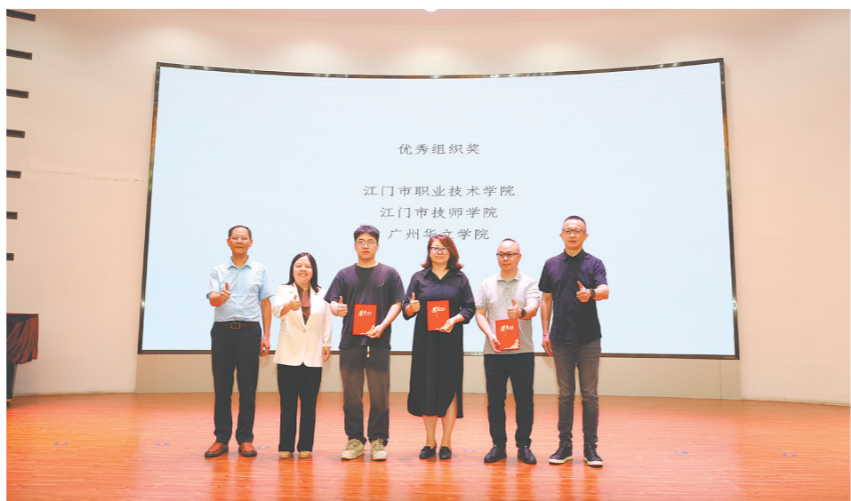
江门职院团队在文创大赛中收获佳绩。

在本次大赛中，“侨物志”团队的《江门之韵》非遗手工作品格外引人注目。3件作品取材于荷塘纱龙、以鹤山狮艺为原型的“醒狮纳福”以及新会鱼灯的“鱼灯送吉”，将传统剪纸工艺与现代光影装置巧妙融合，探