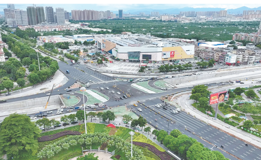
国道G240新会大道段启超隧道上方南北互通道路试通行。

接下来,各参建单位将持续加大施工投入,严把工程安全关、质量关,全力推进国道G240新会段后续工程建设,力争早日实现全线贯通目标。