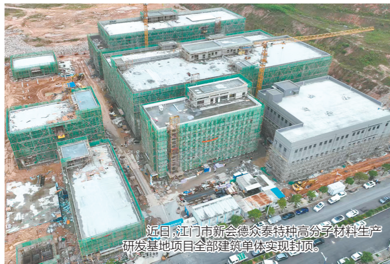
近日,江门市新会德众泰特种高分子材料生产研发基地项目全部建筑单体实现封顶。