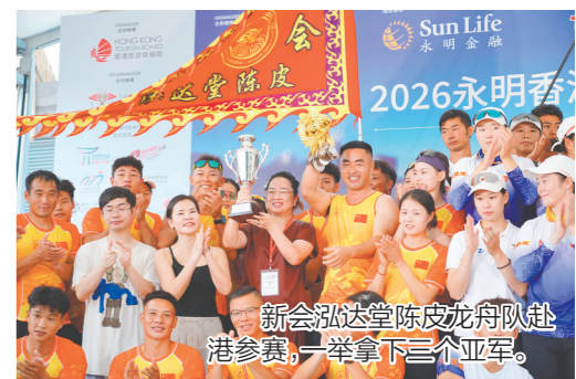
新会泓达堂陈皮龙舟队赴港参赛,一举拿下三个亚军。

值得一提的是,赛事现场,身着印有“泓达堂陈皮”标识队服的健儿成为维港一道独特风景线。不少香港市民、海外游客驻足观赛,在感受龙舟竞渡热血沸腾的同时,了解新会陈皮文化,实现非遗体育与特色产业的双向赋能。