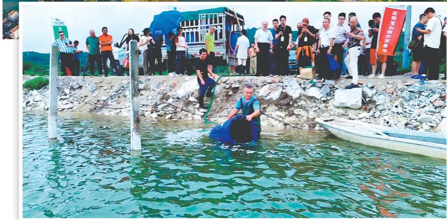
▲日前,随着30万尾优质澳洲宝石斑鱼苗被投放至鹤山市古劳镇丽水新村示范养殖基地,牧笛川梭宝石斑全产业链项目正式启动。

日前,随着30万尾优质澳洲宝石斑鱼苗被投放至鹤山市古劳镇丽水新村示范养殖基地,牧笛川梭宝石斑全产业链项目正式启动。该项目由广东牧笛川梭农业科技集团(以下简称“牧笛公司”)、鹤山市金晟农业产业发展有限公司(以下简称“强村公司”)、鹤山市古劳源乡文化旅游发展有限公司(以下简称“源乡公司”)三方联合共建,旨在推动古劳镇水产养殖业向集约化、规模化、现代化转型,并对该镇智慧渔业的发展起到示范引领作用。