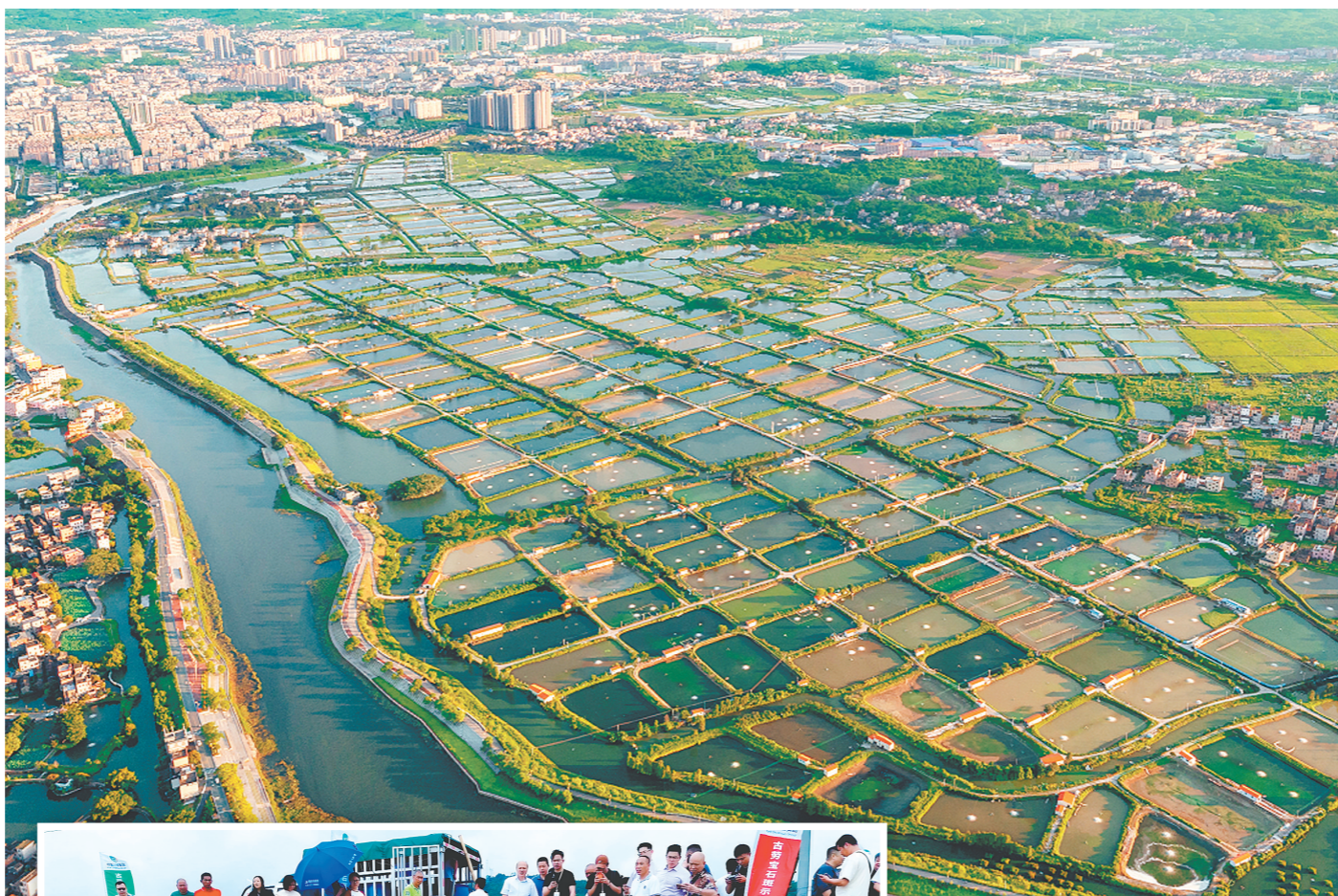
▲古劳镇水产养殖业基础扎实,资源禀赋突出。