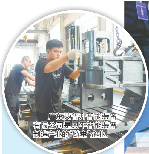
广东艾普升智能装备有限公司是恩平智能装备制造产业的“链主”企业。