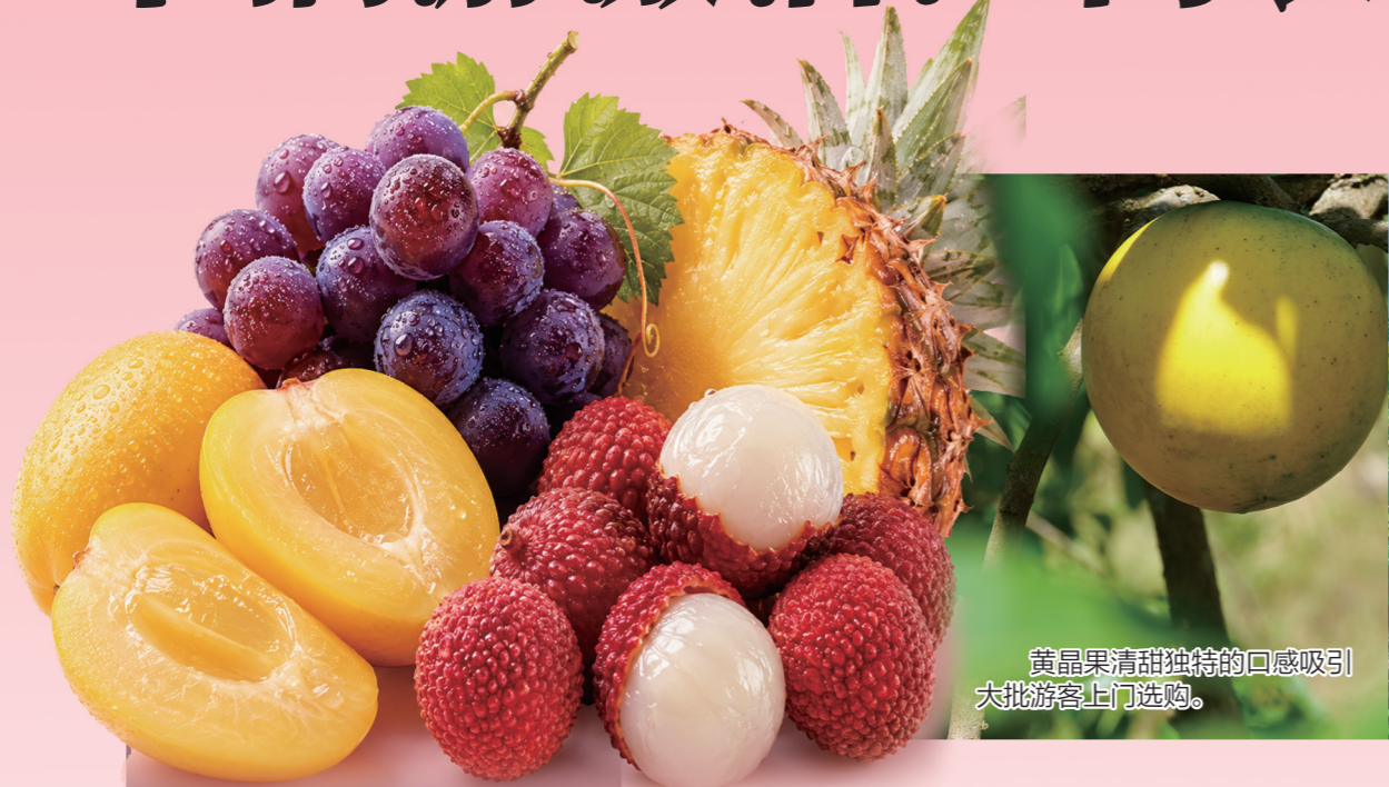
黄晶果清甜独特的口感吸引大批游客上门选购。