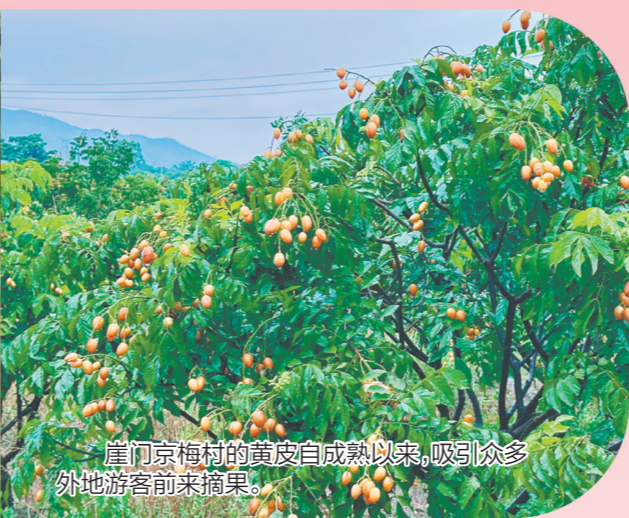
崖门京梅村的黄皮自成熟以来,吸引众多外地游客前来采摘。