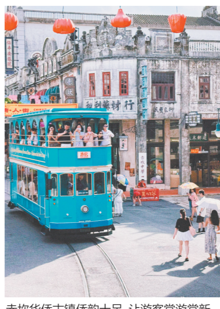
赤坎华侨古镇侨韵十足,让游客常游常新。