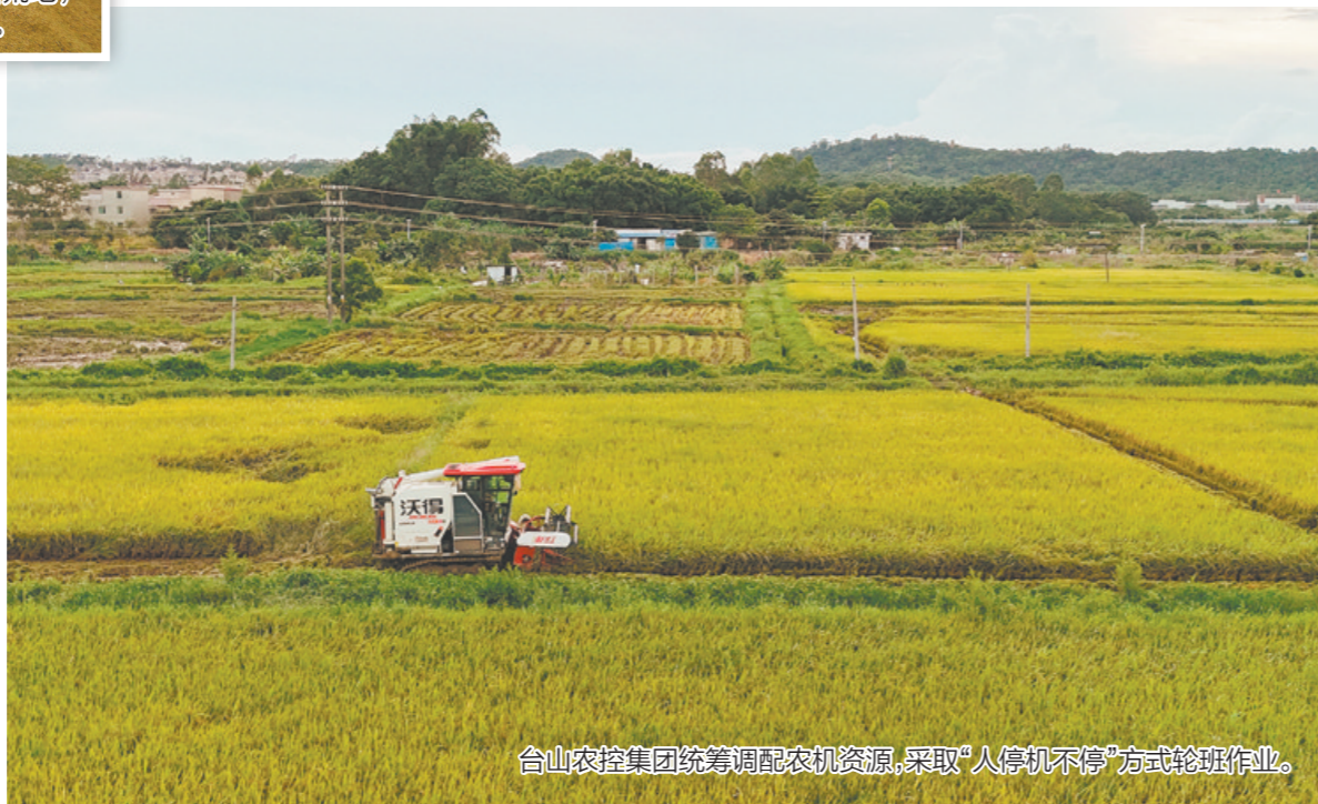
台山农控集团统筹调配农机资源,采取“人停机不停”方式轮班作业。