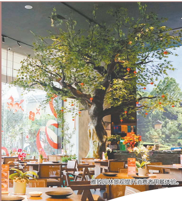
雅致园林景观提升消费者用餐体验。