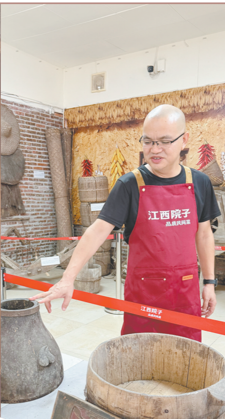
餐馆打造老物件展区,宣传地方文化。