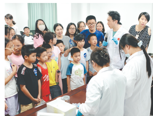
科研人员现场开展标准化实验演示。

江门日报讯(文图 记者/傅雅蓉)近日,“侨乡科学探秘”科普研学活动走进五邑大学华南生物医药大动物模型研究院,聚焦生物医药与生命科学领域,以专业授课、实景演示、基地探秘为核心,为青少年打造了一场高规格、专业化的科研启蒙课堂,让侨乡青少年近距离接触前沿科研成果。