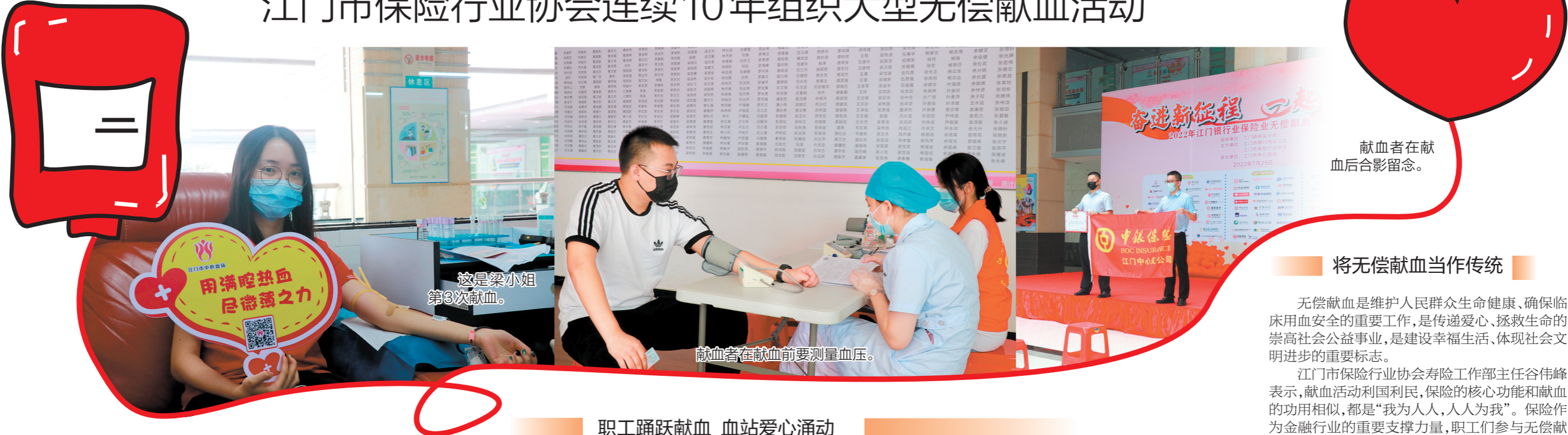
献血者在献血后合影留念。