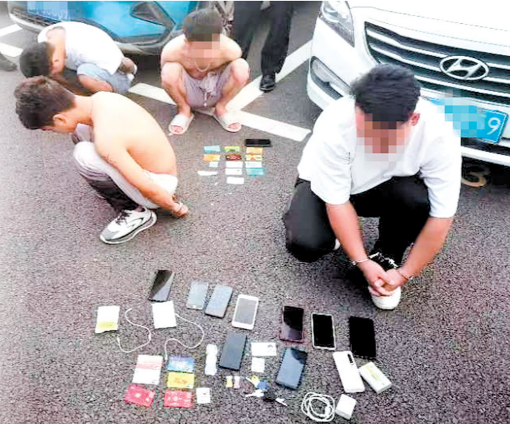
公安机关打防管控多措并举,有效遏制电信网络诈骗犯罪多发高发态势。图为电诈嫌疑人被抓。