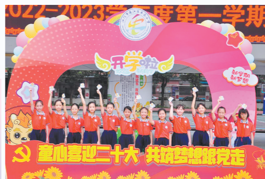
丰乐小学学生童心向党，共筑梦想。