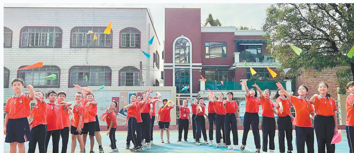
江华小学(群华校区)的萌娃们精神抖擞迎接新学期。