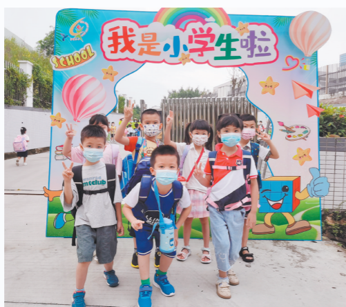
在鹤山一中附属小学，新生跨过彩虹桥，开启小学生活。

统筹/姜丹