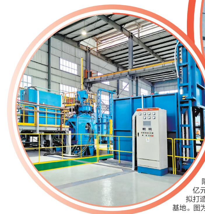
广东华整合金新材料有限公司正式启动投资50亿元的航空新材料产业园项目,拟打造广东省最大、以高温合金为主的航空新材料基地。图为该企业研发大楼和生产车间。