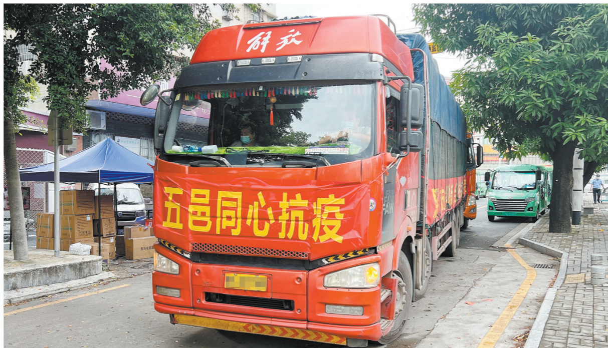
自新会区新冠肺炎疫情发生以来,情同手足的蓬江、江海、台山、开平、鹤山、恩平伸出援手,从物资、人力等方面紧急支援新会。图为恩平运送物资的卡车有序进入新会物资转运点。