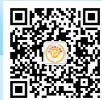
扫描二维码了解详情

报名方式：关注“江门市放心消费”微信公众号点击菜单“关于我们”报名，最终确认报名成功的名单以接到主办方电话通知为准。未接到电话通知，即表示名额已满，报名未成功。身份证号码用于购买保险，请正确填写。