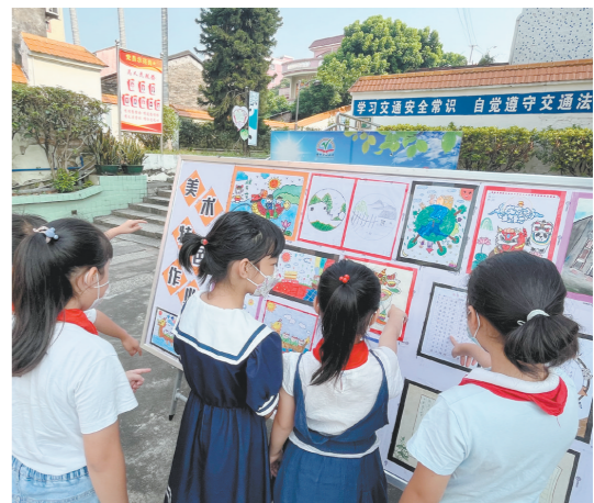
同学们在观看作业展。

江门日报讯（文/图 记者/潘诗欣 通讯员/林家辉）千层花轿少年七巧板、栩栩如生的赛龙舟、图文并茂的成语接龙……在蓬江区棠下镇中心小学暑假作业展上，一份份精美的作品记载着同学们的快乐暑假生活，展示着“双减”多彩成果。