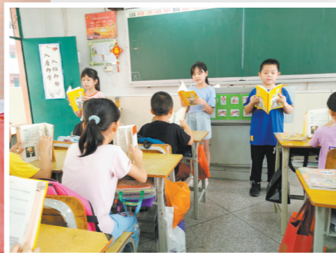
▲每天早上，“领读员”用响亮的声音带动全班早读。