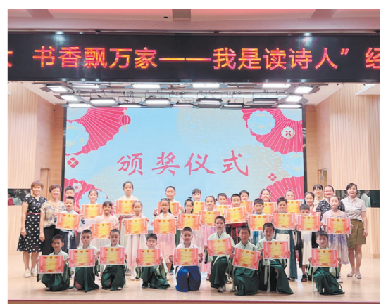
学校为获奖选手颁发奖状。

江门日报讯（文/图 记者/潘诗欣 通讯员/李彩霞）“青青园中葵，朝露待日晞。阳春布德泽，万物生光辉”“好雨知时节，当春乃发生。随风潜入夜，润物细无声”……9月16日下午，江海区银泉小学举行“我是读诗人”经典诵读比赛决赛，参赛选手以饱满的精神、扎实的朗诵技巧和新颖的创意，把观众带入了星河灿烂、美妙无比的诗词世界，充分感受祖国的壮美河山和诗人的爱国情怀。