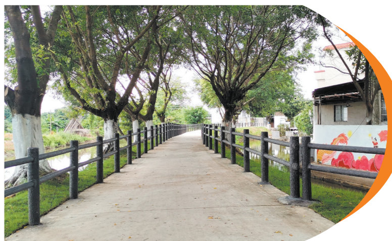
石龙围河涌经过整治后，周边也变得很美丽。

逐年提高到950元；投入1950万元，完成白藤小学、远昌小学、良山小学、荷塘中学等8所中小学校校舍、场地维修改造，办好人民满意教育；推动荷塘卫生院升级改造工程，深化江门市人民医院与荷塘卫生院共建紧密医联体模式，满足人民群众健康需要。全镇以“小网格”推动“大党建”，建立41个综合网格、136个片区，并在网格中成立36个党组织，筑牢基层治理根基。