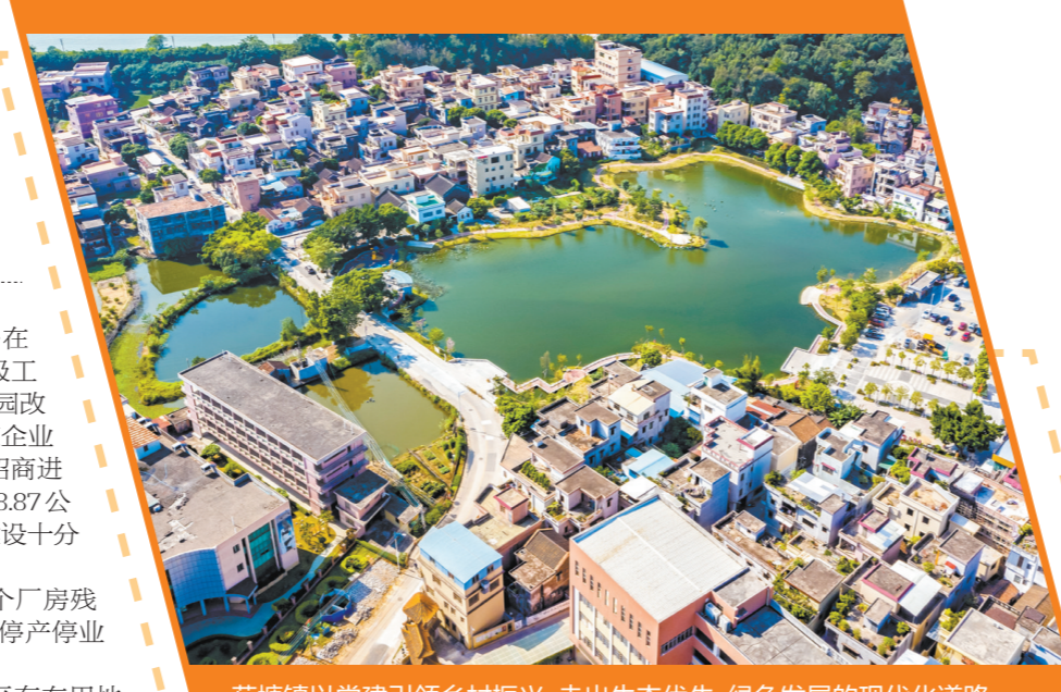
荷塘镇以党建引领乡村振兴，走出生态优先、绿色发展的现代化道路。

此外，荷塘镇毫不放松抓好常态化疫情防控，坚持把人民群众生命安全放在第一位，充分运用“大数据+网格化”及时开展高风险地区人群排查，落实健康管理措施，为全区疫情防控工作保驾护航。其中，该镇着力打击境外走私涉疫行为，持续开展“三无”船舶整治清理工作和跨境货车货物作业点核查，加强进口冷链食品违法违规行为整治，加强联合执法，确保社会和谐、大局稳定。