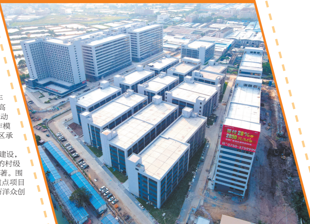
荷塘康溪工业园是我市首个村级工业园区改造试点项目。