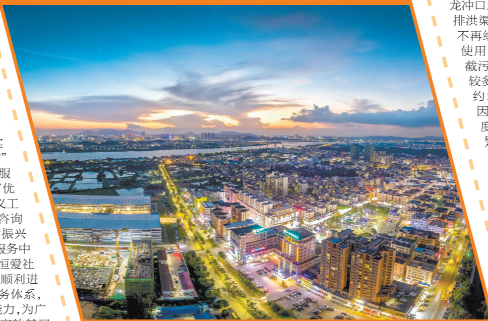
荷塘镇区位优势明显，充满活力。