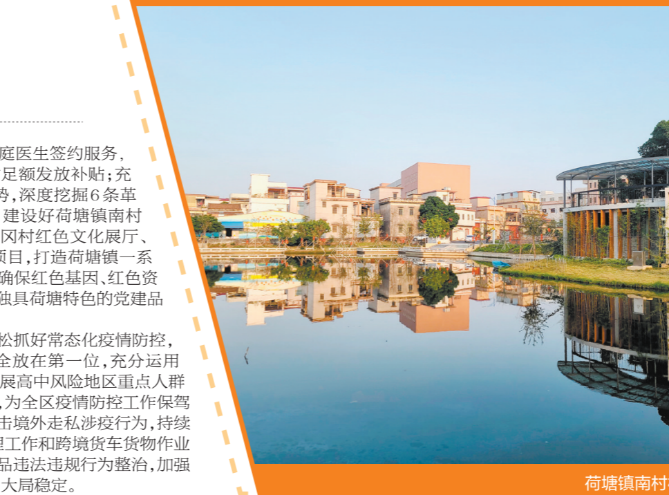
荷塘镇南村村环境优美。