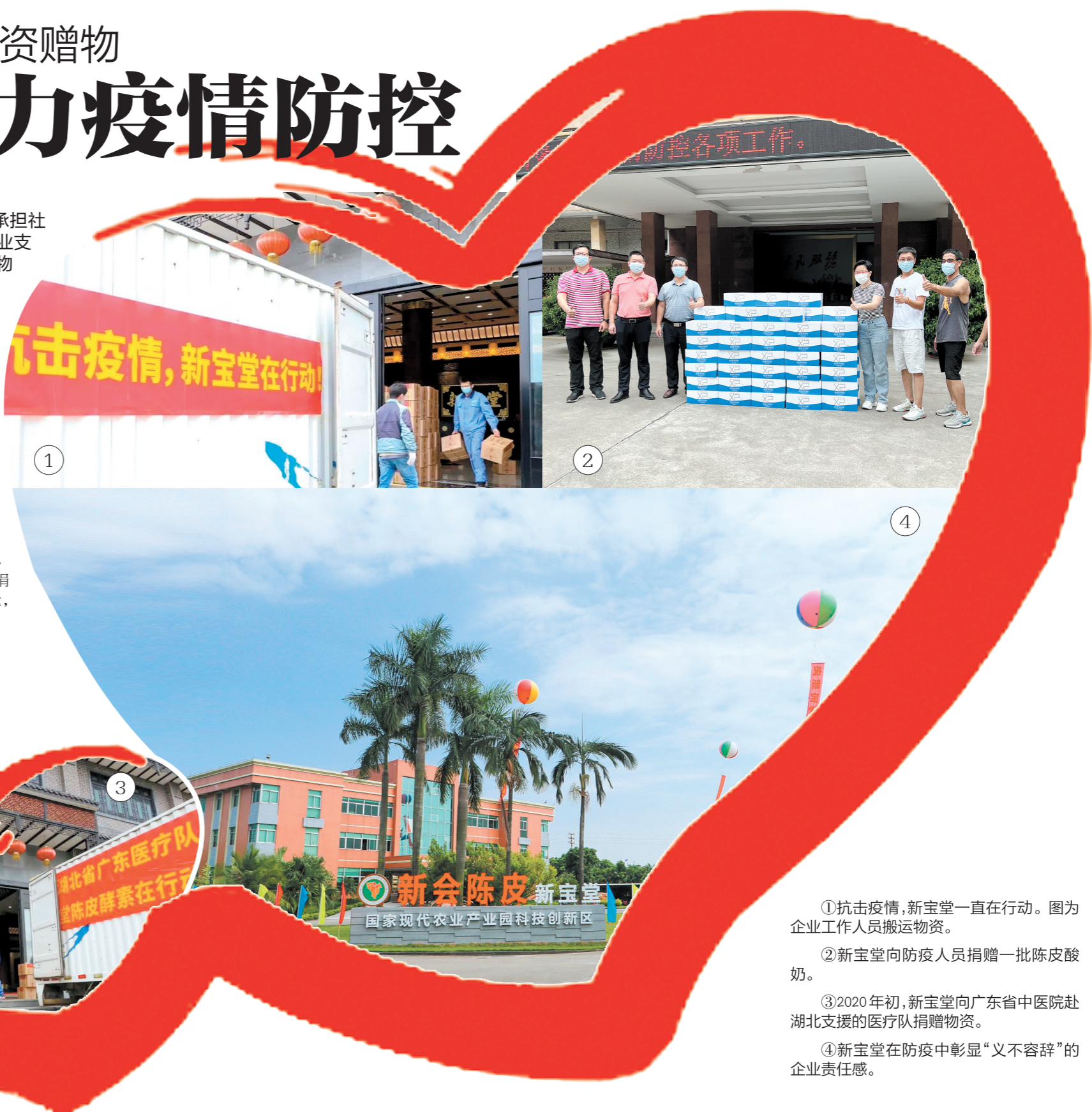
①抗击疫情，新宝堂一直在行动。图为企业工作人员搬运物资。 ②新宝堂向防疫人员捐赠一批陈皮酸奶。 ③2020年初，新宝堂向广东省中医院赴湖北支援的医疗队捐赠物资。 ④新宝堂在防疫中彰显“义不容辞”的企业责任感。

除针对疫情的捐赠外，新宝堂还关注环卫工人、学生等群体，2015年至今，累计捐资赠物594.7万元。