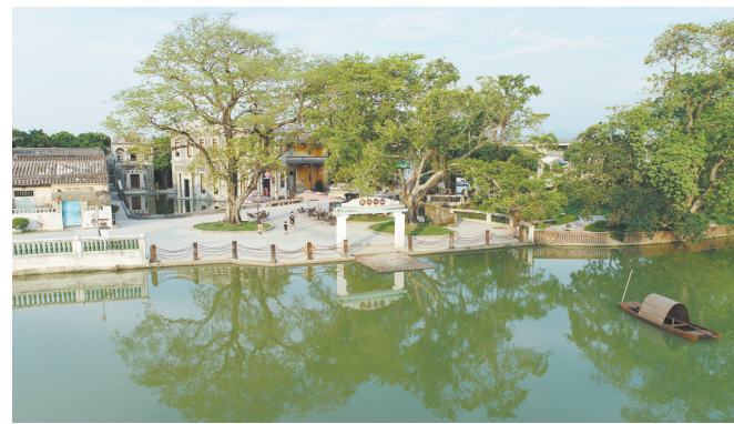
将草坪村打造成乡村振兴示范点,乘着乡村振兴的东风,水步镇不断提升镇域品质内涵,城镇面貌焕然一新。

志不求易者成,事不避难者进。十年来,水步镇上下努力奋斗、开拓创新,经济社会健康平稳发展,城乡面貌日新月异,人民生活水平显著提高,社会事业全面进步。踏上新征程,水步镇将凝心聚力、奋发有为,努力实现人民对美好生活的向往,奋力谱写发展新篇章。