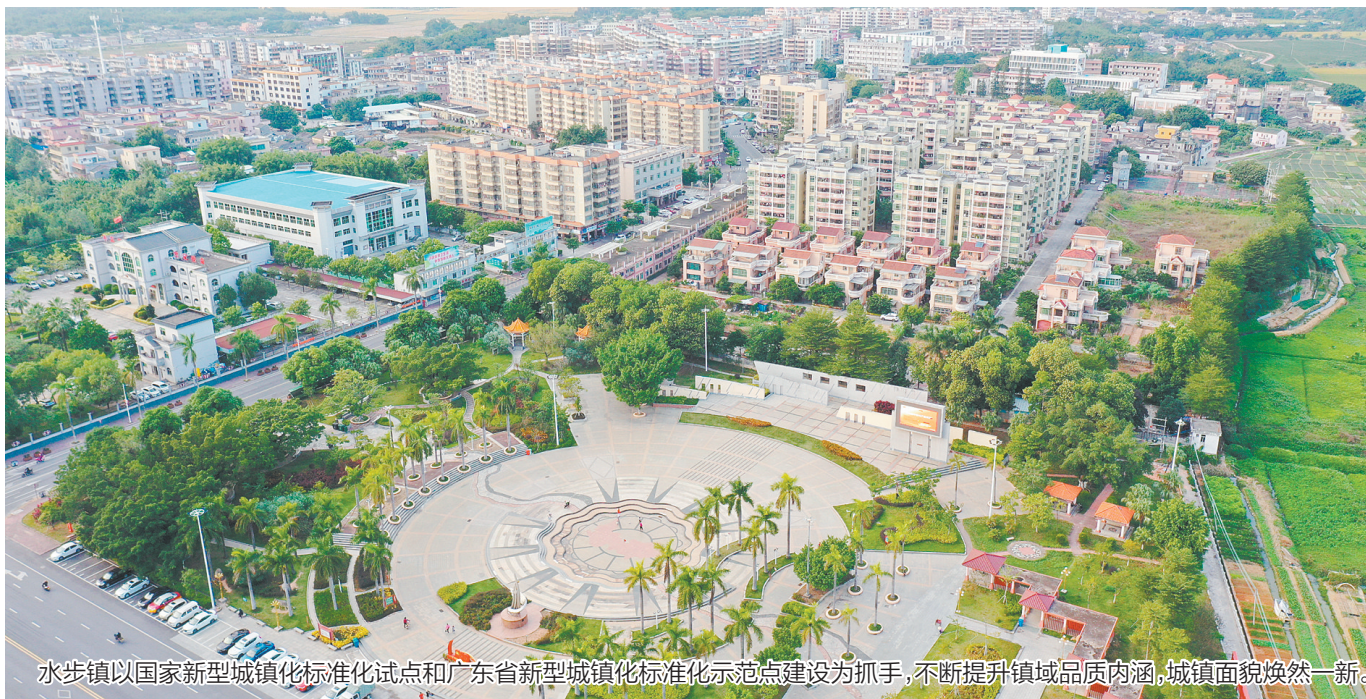
水步镇以国家新型城镇化标准化试点和广东省新型城镇化标准化示范点建设为抓手,不断提升镇域品质内涵,城镇面貌焕然一新。

水步镇坚持科技引领,聚焦粤港澳大湾区产业链,瞄准新材料、集成电路、智能装备制造等新兴产业,引入龙头企业,打造产业升级新引擎。2017年9月落户水步镇的松田电工(台山)有限公司是微组及特种漆包线领域的龙头企业,2021年斩获第十届中国创新创业大赛广东赛区一等奖、第十届中国创新创业大赛江门赛区暨2021年江门市“科技杯”创新创业大赛成长企业组特等奖,2022年被认定为国家级专精特新“小巨人”企业。