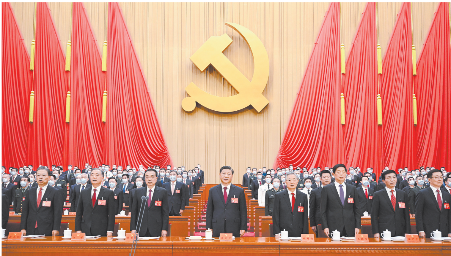
10月16日,中国共产党第二十次全国代表大会在北京人民大会堂开幕。这是习近平、李克强、栗战书、汪洋、王沪宁、赵乐际、韩正、胡锦涛涛在主席台上。

据新华社北京10月16日电 凝心聚力擘画复兴新蓝图,团结奋进创造历史新伟业。举世瞩目的中国共产党第二十次全国代表大会16日上午在人民大会堂开幕。