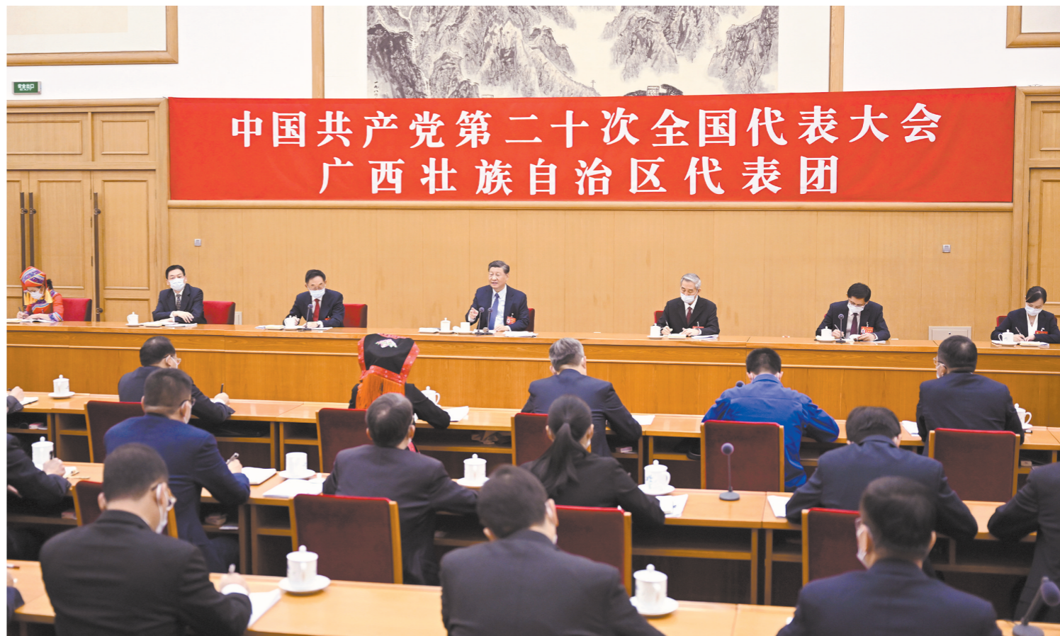
10月17日，习近平同志参加党的二十大广西代表团讨论。

据新华社北京10月17日电 习近平同志17日上午在参加党的二十大广西代表团讨论时强调，党的二十大报告进一步指明了党和国家事业的前进方向，是我们党团结带领全国各族人民在新时代新征程坚持和发展中国特色社会主义的政治宣言和行动纲领。学习贯彻党的二十大精神，要牢牢把握过去5年工作