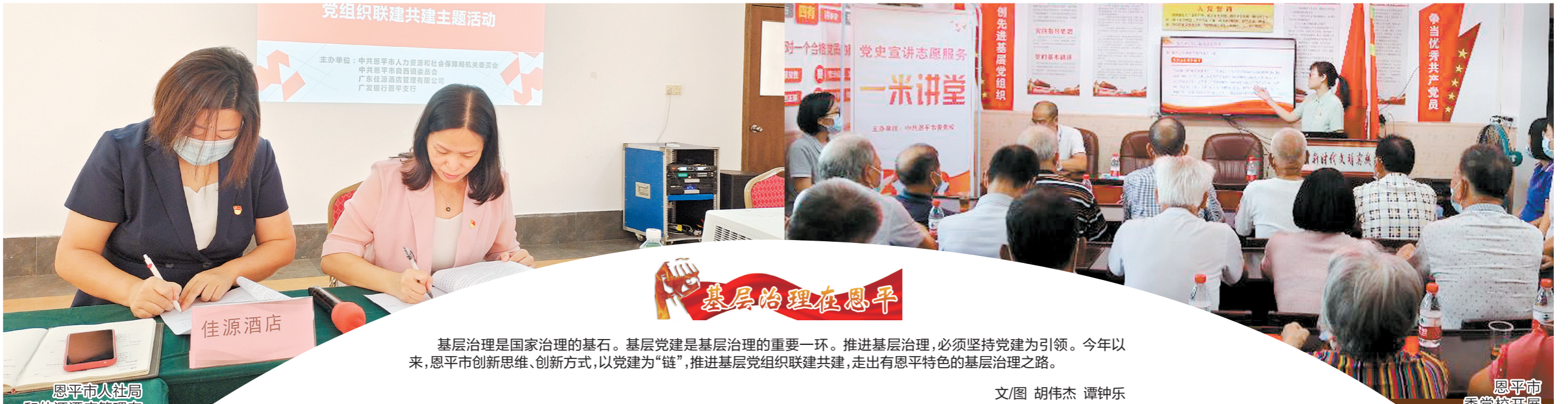
恩平市人社局和佳源酒店管理有限公司签订党建联建共建协议。