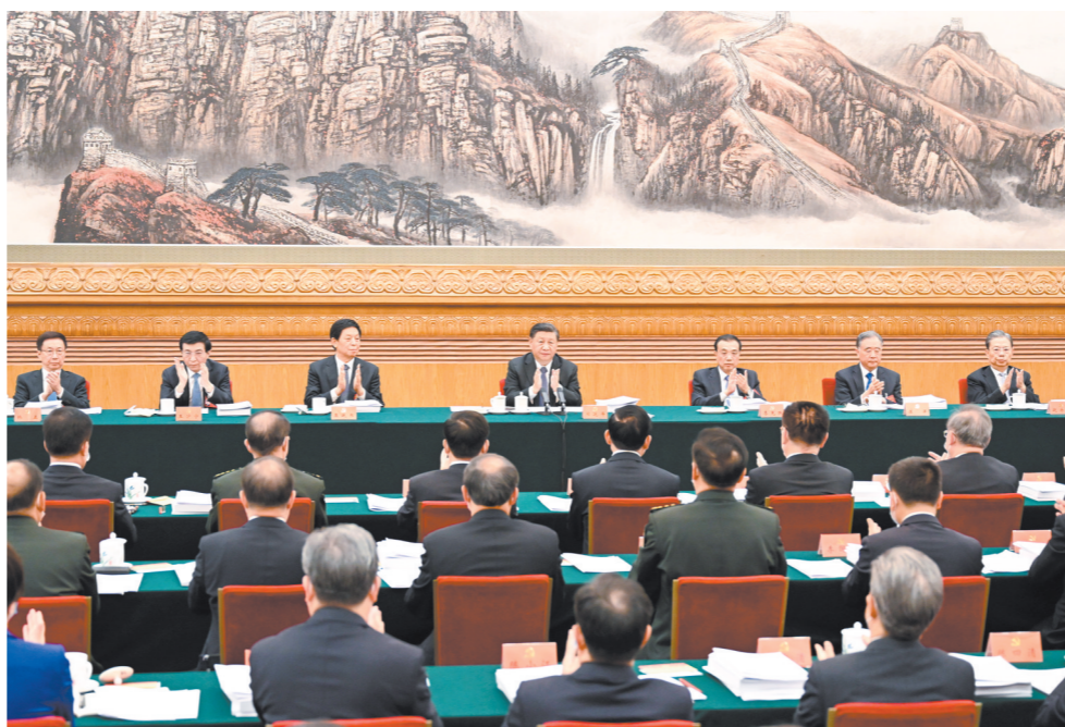
10月18日,中国共产党第二十次全国代表大会主席团在北京人民大会堂举行第二次会议。习近平、李克强、栗战书、汪洋、王沪宁、赵乐际、韩正等出席会议。

据新华社北京10月18日电 中国共产党第二十次全国代表大会主席团18日下午在人民大会堂举行第二次会议。习近平同志主持会议。