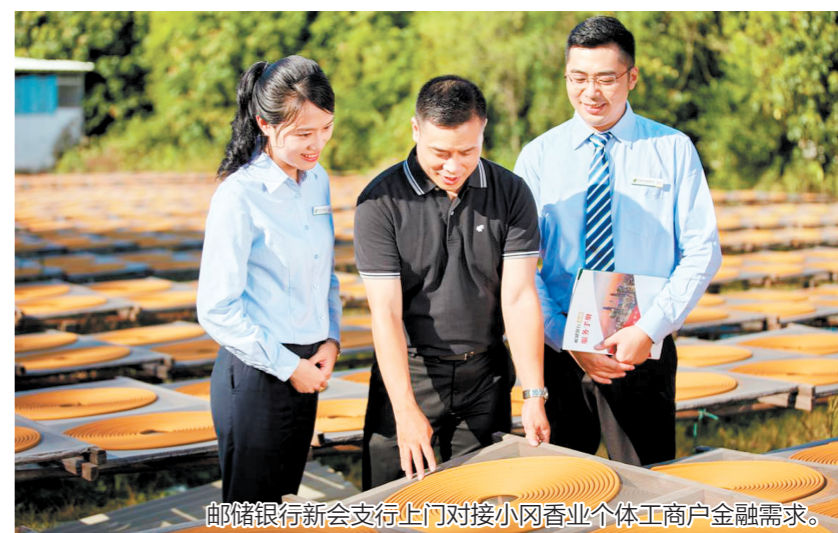
邮储银行新会支行上门对接小冈香业个体工商户金融需求。

小冈,位于新会区,拥有众多的香制品加工厂。小冈是中国乃至全球最大的香业产业基地之一,产品以出口为主。 在国家“一带一路”战略背景下,新会区委区政府大力推动小冈香业转型发展,成立了新会制香行业协会和建造新会区宝骏小冈香业城。为支持小冈制香行业的发展,邮储银行新会支行先后打造了制香行业流水贷及香业信用贷、抵押贷等融资产品,为小冈香业城及分布周边的香业个体工商户提供金融服务。 “小冈香业拥有600多年的制香历史,可以说有华人的地方就有小冈香。小冈香业加快转型发展,从单一的手工业,向产品多样化发展,如开发高端沉香精油等天然养生产品,应用到各种日用品中。在转型发展过程中,我们也面临着很大的挑战,如聘请专业人士的费用、场地扩大需求费用等。邮储银行能通过行业特色贷款为我们提供资金帮助,有效解决在转型发展下的资金短缺困境。”小冈香业联合会相关负责人表示。 据悉,邮储银行已为香业企业主开通绿色通道进行审查审批,信用单笔最长贷款期限1年,有抵押物的可达5年,主要以按周期结算到期还本、按周期结息、按还本计划还本等三种还款方式为主,为企业主提供还款便利。目前邮储银行的“香业贷款”累计授信3000余万元,为上百家香厂注入“金融活水”。 此外,该行还通过“信用+产业”方式大力推进信用建设,不断完善金融产品和服务体系,推出“线上信用贷款”,助力当地制香行业发展。在新会双水镇南水村,邮储银行新会支行通过与镇政府、村委会的迅速对接,首先对村内香业协会的会员进行评定,匹配基础信用额度;其后以上门服务、批量评定的方式,确定每周三为“信用村走访日”,由客户经理通过移动展业,逐一上门评定,并通过村委会邀约当地的农户、商户进行批量评定,大大提高了信用评定的效率,实现“信用村+产业”的共同推动,也为加快香业这一地方传统特色产业转型发展作出积极贡献。(文图 千青 黄雪玲)