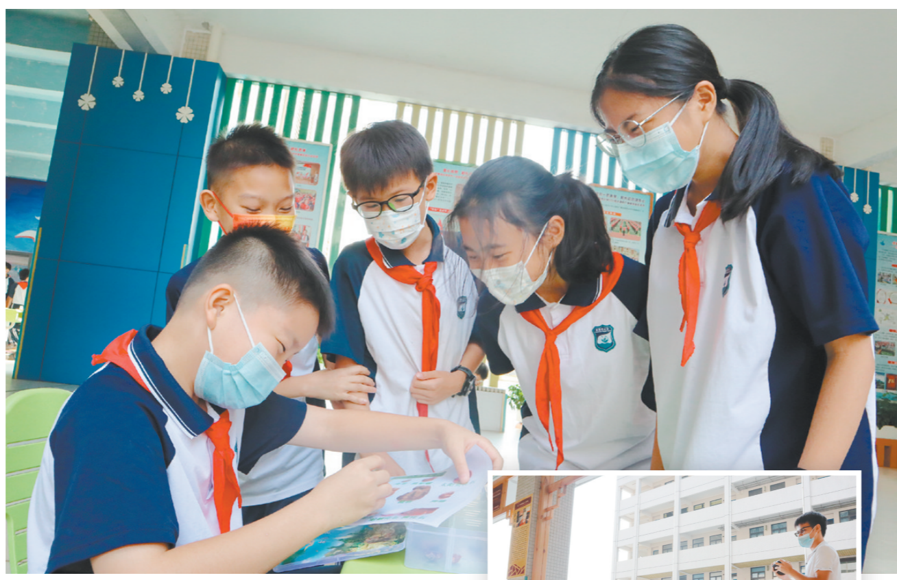
▲在科普体验互动区,数十种科普实验供学生学习体验。

“干冰也就是固体的二氧化碳”“不可以直接用手抓取干冰……”学校特邀江海区科技馆的老师们现场展示“空气炮”“梦幻干冰秀”和“神奇的静电”三个科学实验,带来“科普进校园精彩科技秀”。在观看实验过程中,学生们踊跃回答老师的提问,积极参与实验操作,