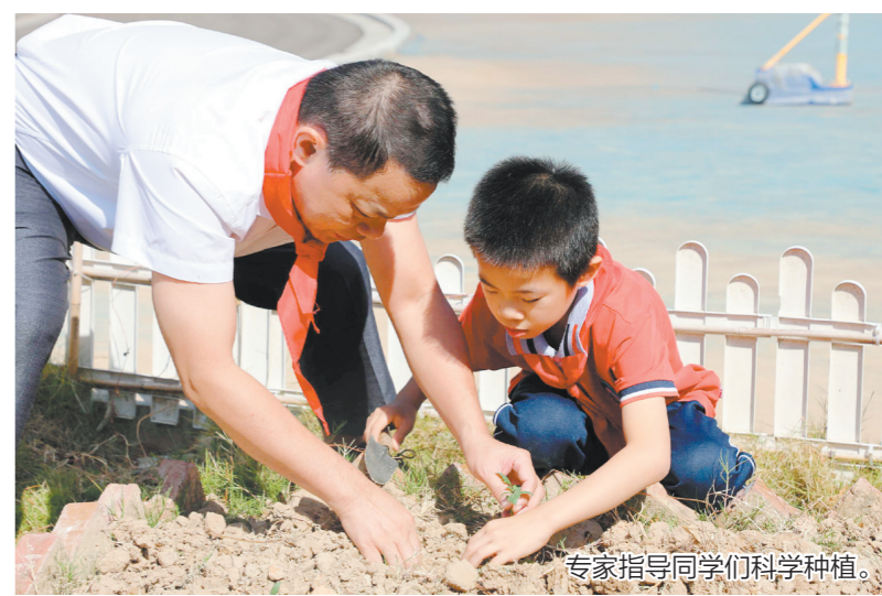
专家指导同学们科学种植。

江门日报讯(文/图 记者/张翠玲) “同学们,你看,挖坑埋苗之后,要把土填回去,然后浇水……”蓬江区里仁小学的“立人农场”热闹极了,大家在一起研究如何把农作物种得更科学。近日,里仁小学联合江门市农业科学研究所共同开展了“党建带团建,专家引领,特别的劳动专业的课”实践活动,共同探索党建引领下校园劳动实践基地的共建与研究。