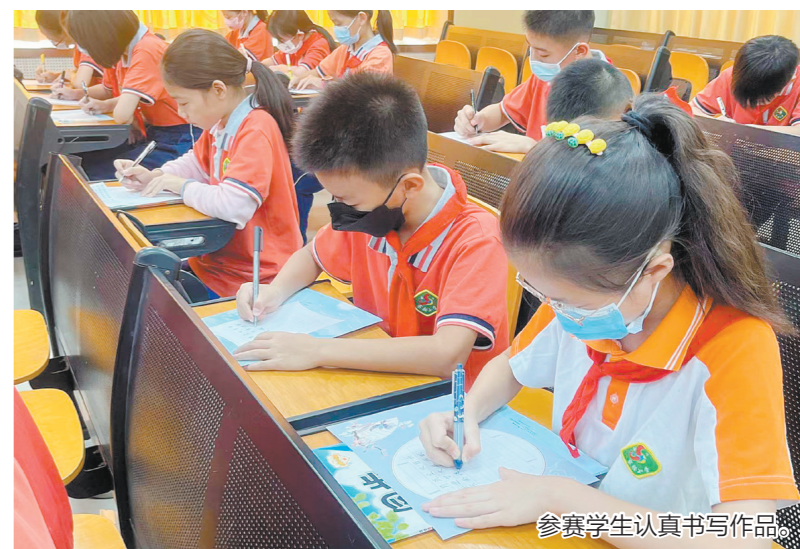
参赛学生认真书写作品。

江门日报讯(文/图 记者/潘诗欣 通讯员/范场莉) 一横一竖,一撇一捺,一个个汉字跃然纸上……近日,蓬江区棠下镇实验中心小学举行硬笔书法大赛。同学们坐姿端正,握笔规范,神情专注地书写参赛作品。