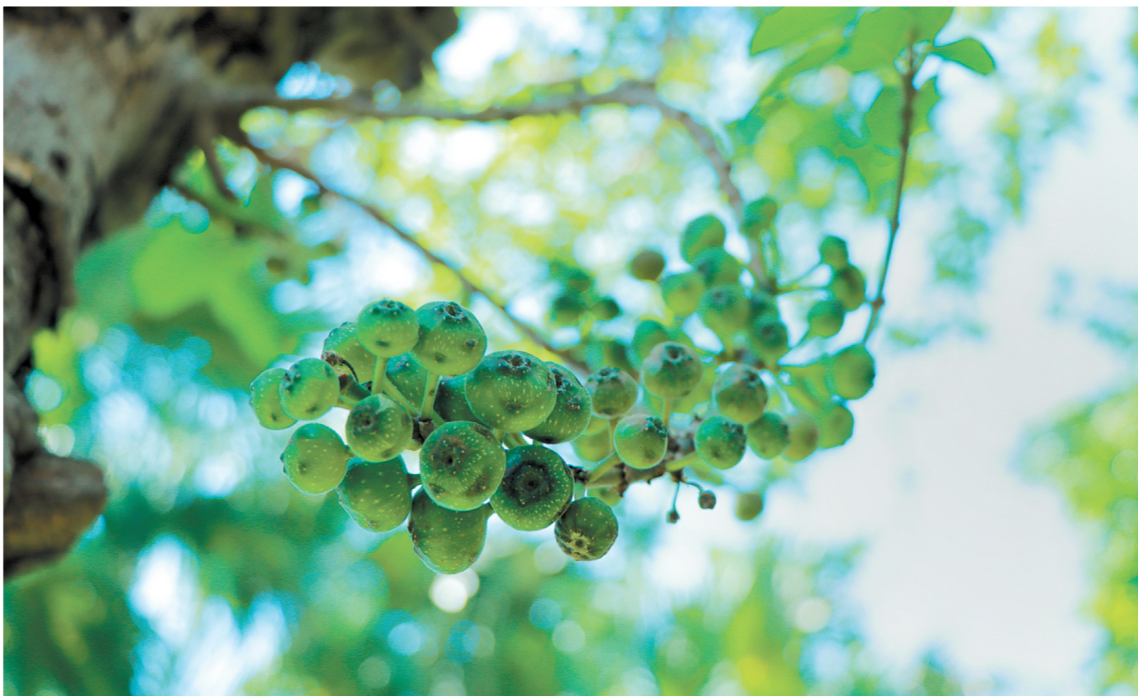
《果实累累》

我们仍感觉生活在 热烈的夏 其实秋天已悄然而至 侨都大地已画上了她的色彩 在这里，我看见 农民镰刀上的秋色 在这里，我看见 渔民网回了满舱的秋 在这里，我看见 果农在采摘金色的秋 在这里，我看见老百姓 菜篮子里盛满了秋的果实 在这里，我看见侨都人脸上 溢满了秋天的甜蜜