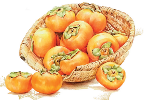
每到这个时节，我总是能想起柿饼那诱人的香味。

外公说，柿饼有润燥、化痰、止咳的作用，吃了很有益处。不过，柿饼好吃却也有一些禁忌，例如吃柿饼前后一到两小时内不能饮酒，柿饼遇酒就容易凝结，难以消化。