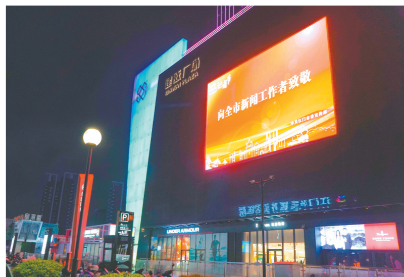
11月8日,我市亮灯庆祝第23个中国记者节。

自1996年举办首届以来,中国航展已成为集中展示中外航空航天先进技术和高端装备的重要窗口、促进航空航天技术和装备领域商贸合作的国际平台。