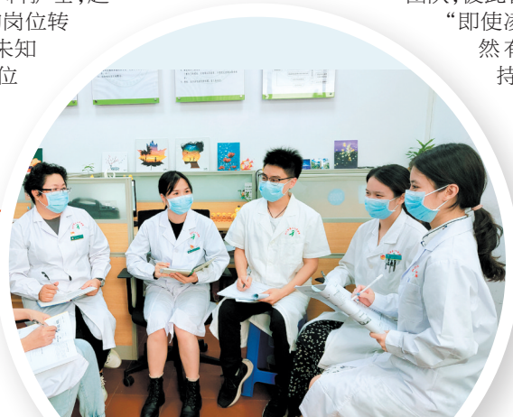
心理援助热线组坚持定期开展业务学习与督导学习。

他们拥有一个既团结又有活力的团队,彼此监督互相帮助,“即使凌晨两三点,仍然有队员陪伴支持。”