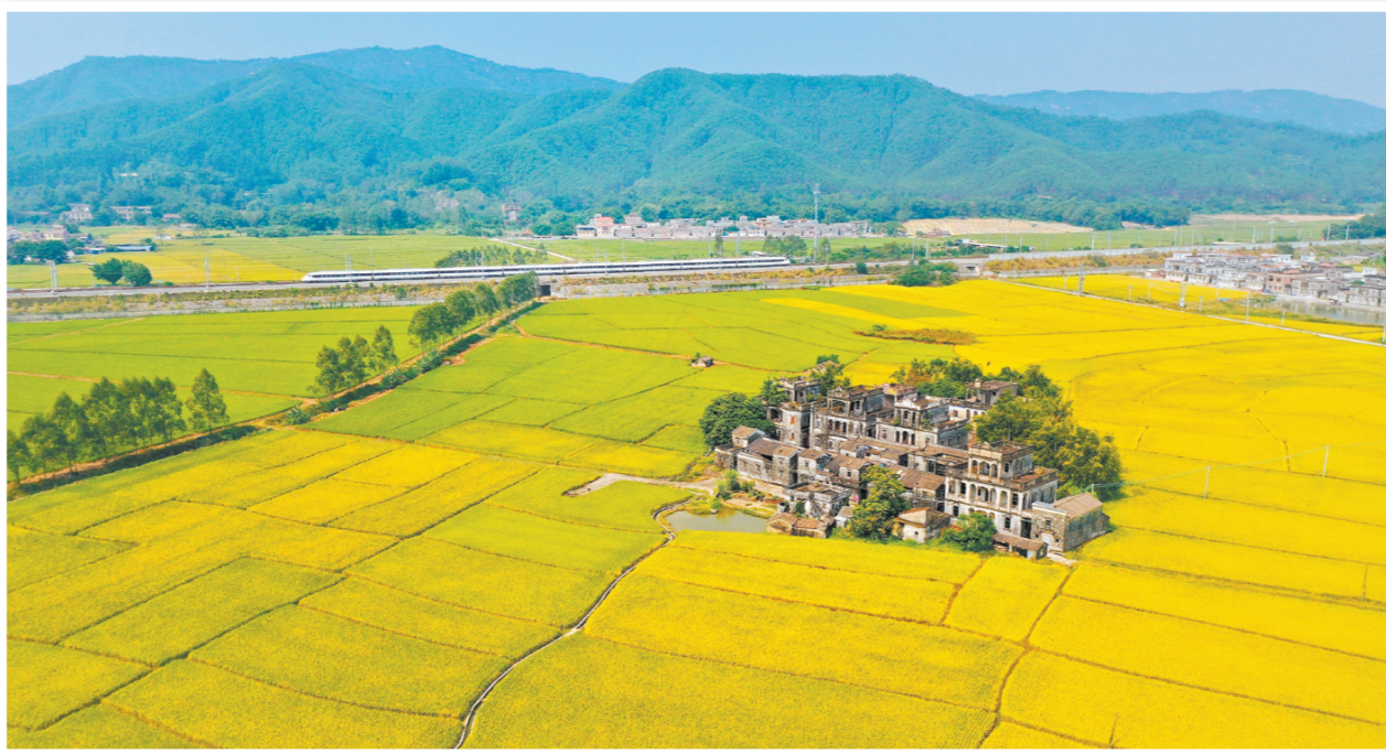
《美丽的家园》