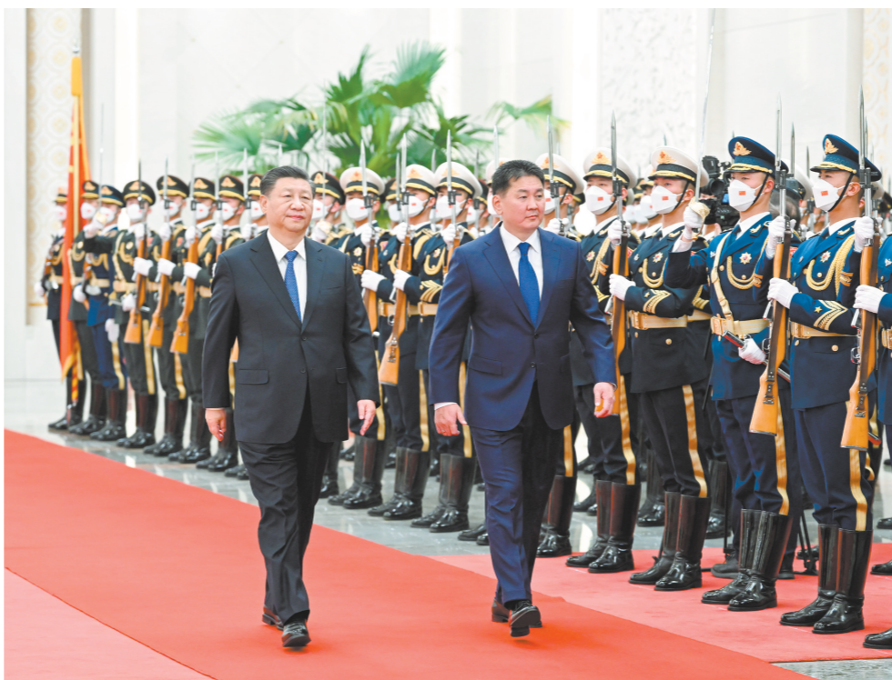
11月28日,国家主席习近平在北京人民大会堂同来华进行国事访问的蒙古国总统呼日勒苏赫举行会谈。这是会谈前,习近平在人民大会堂北大厅为呼日勒苏赫举行欢迎仪式。

新华社北京11月28日电 11月28日下午,国家主席习近平在人民大会堂同来华进行国事访问的蒙古国总统呼日勒苏赫举行会谈。 习近平欢迎呼日勒苏赫访华。习近平指出,我们时隔两月如约再次会面,充分体现了中蒙关系的高水平。中蒙互为重要邻国,保持中蒙长期稳定的睦邻友好合作关系,符合两国人民根本利益。中国坚持亲诚惠容理念和与邻为善、以邻为伴周边外交方针,高度重视深化中蒙友好互信和利益融合。双方携手抗疫,守望相助,弘扬了传统友谊。两国各领