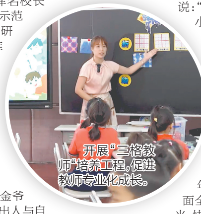
开展“三格教师”培养工程，促进教师专业化成长。

同时，学校依托广东省梁又晖名教师工作室、蓬江区梁又晖名校长工作室、江门市校本研修示范校以及学校课程建设与教研中心等平台，构建多维度学习共同体，积极带动区域内学校发展和教师专业成长，充分发挥示范引领和辐射作用。