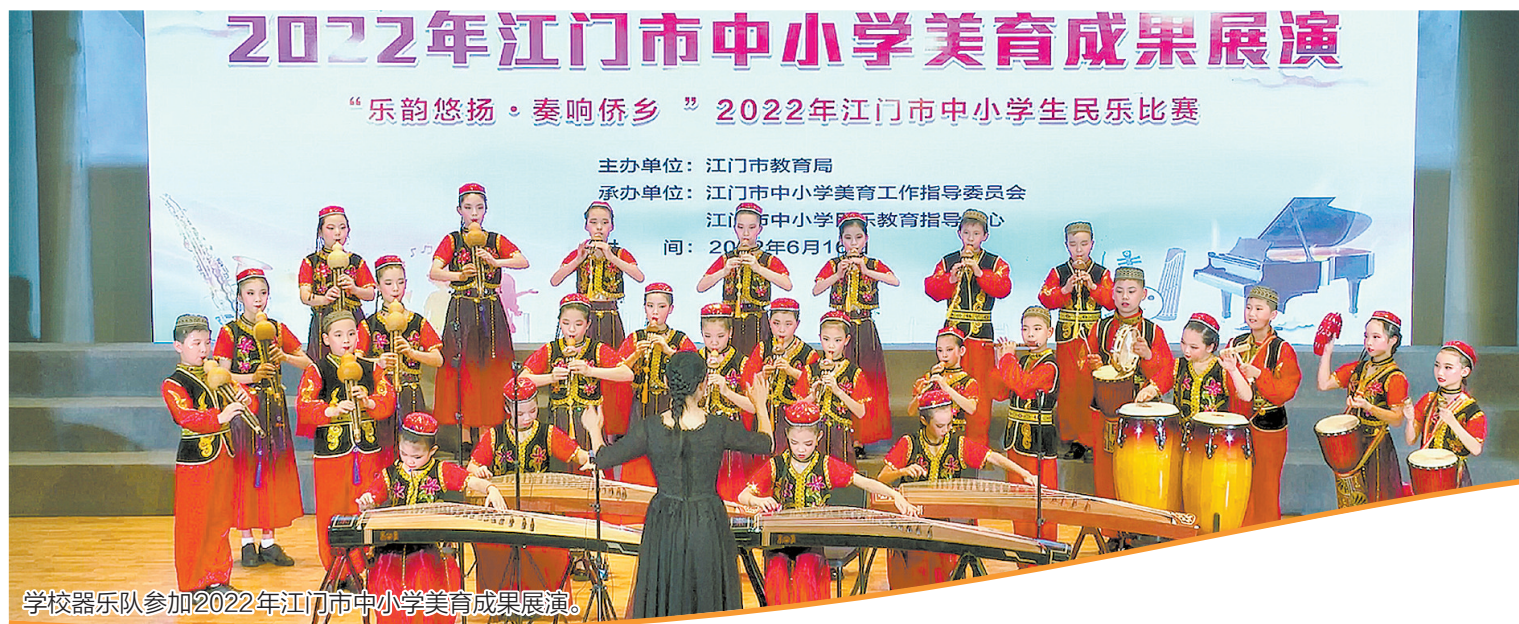
学校器乐队参加2022年江门市中小学美育成果展演。