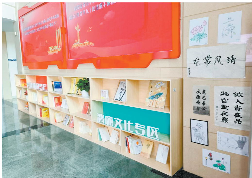
一朵朵象征“廉洁”的青莲是作品展的“主角”。