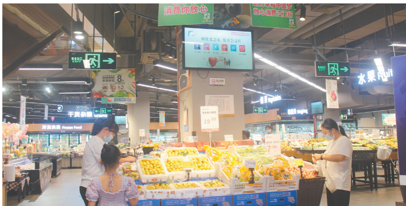
通过消费体验，志愿者表示大部分商家做得比较好。