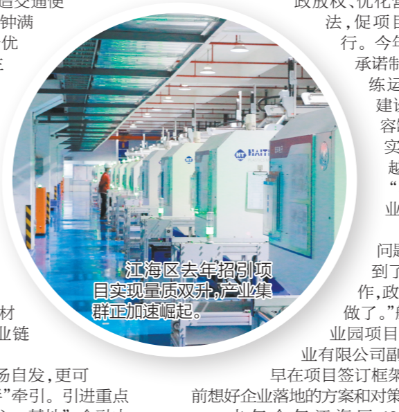
江海区去年招引项目实现量质双升,产业集群正加速崛起。