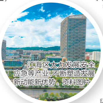
江海区大力发展安全应急等产业,不断塑造发展新动能新优势。资料图片