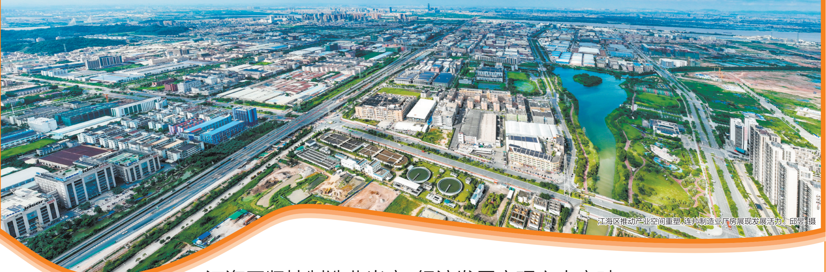
江海区推动产业空间重塑,连片制造业厂房展现发展活力。

刚刚过去的2022年,着实不太寻常。百年未有之大变局叠加新冠疫情,让经济社会发展承压迎考。面对艰难险阻,江海区迎难而上,乘风破浪,保持了经济社会大局稳定,实现了发展质量稳步提升。作为江门主城区之一和国家高新区所在区域,江海区再展担当,在多轮疫情冲击下,奋战高质量发展突破年,稳字当头,守正创新,不断探寻新方向、新路径,展现韧性,汇聚力量,收获希望。即日起,本报推出《收获 突破! ——江海高质量发展一线观察》,展示收获,总结经验,为进一步推动江海区向前、向新、向着高质量发展加油鼓劲!