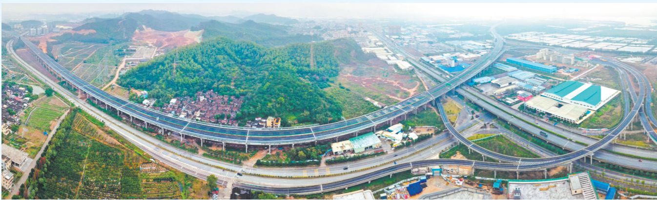
深江高速江门段全长85.597公里,按双向六车道标准建设,设计速度120公里/小时。

深江高速通道全线通车后,从江门中心城区前往深圳只需1个小时,比原来缩短1.5个小时,将有力推动江门深度融入大湾区1小时生活圈,进一步夯实江门承东启西的珠西交通综合枢纽地位。