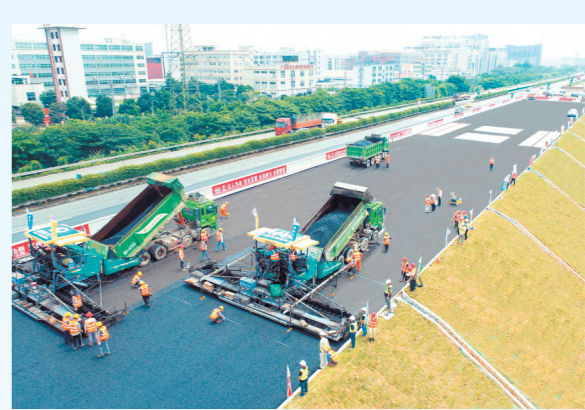
中江高速改扩建项目摊铺“减碳”沥青现场。

与城区市民出行息息相关的另一条高速公路江鹤高速也在去年上半年迎来了全线动工,全程采用双向八车道标准扩建,计划建设周期三年。建成后,将有效实现珠江西岸通道扩容,改善行车条件,提高路网服务水平。