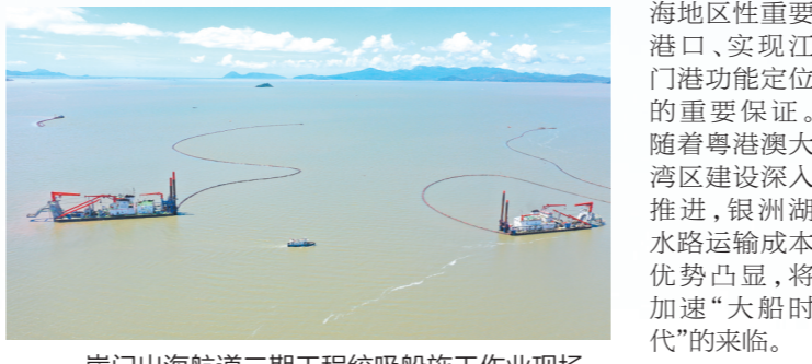
崖门出海航道二期工程绞吸船施工作业现场。

随着粤港澳大湾区加快建设深入推进,银洲湖水路运输成本优势凸显,将加速“大船时代”的来临。