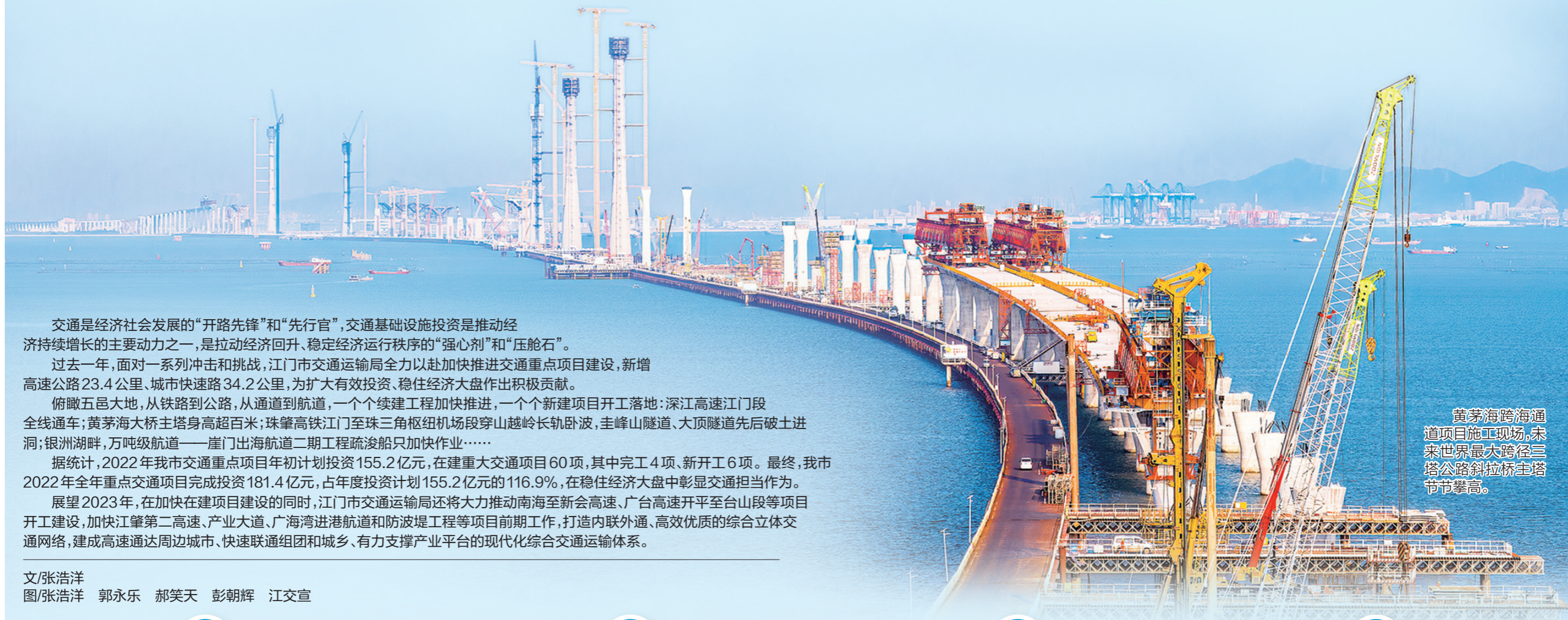
黄茅海跨海通道项目施工现场,未来世界最大跨径三塔公路斜拉桥主塔节节攀高。

交通是经济社会发展的“开路先锋”和“先行官”,交通基础设施投资是推动经济持续增长的主要动力之一,是拉动经济回升、稳定经济运行秩序的“强心剂”和“压舱石”。