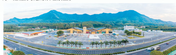
改造后的梁金山服务区“高大上”,最突出的特色是充满侨味。

在广东省内高速服务区中,江门的梁金山服务区规模大、服务优、景观美,比如梁金山服务区全省最大、功能齐全。同时,赤坎、大槐、圣堂、雅瑶等服务区各有千秋,既有商业赋能,又有文化底蕴,公共服务优质,防疫服务到位,有的服务区更是“永不落幕的农业产品展示厅”、旅游文化的浓缩景区。