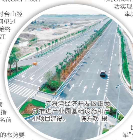
广海湾经济开发区正大力推进产业园基础设施和产业园区项目建设。

基础“稳”了，“进”的态势要进一步强化。2023年1月28日，全省高质量发展大会召开后，台山当天随即开展高质量发展专题调研，台山市四套班子领导深入企业调研并召开现场会议。会议要求，要增强经济发展“等不起、慢不得、坐不住”的紧迫感和责任感，以“起步即冲刺、开局就争先”的奋斗姿态，以“时不我待、只争朝夕”的拼搏精神，掀起齐心协力抓发展的热潮。