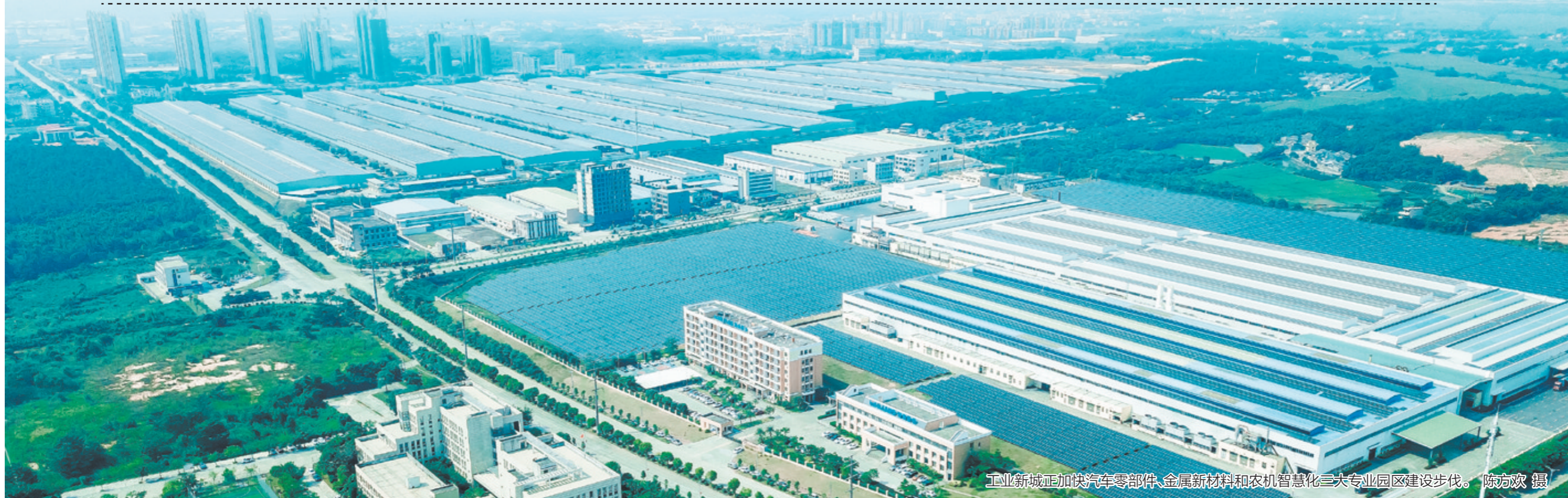
工业新城正加快汽车零部件、金属新材料和农机智能化三大专业园区建设步伐。