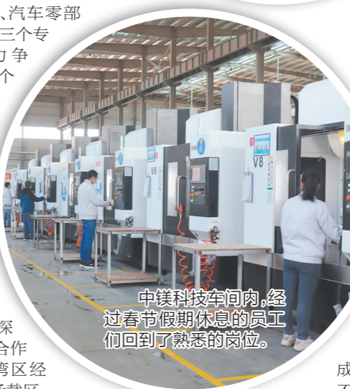
中镁科技车间内，经过春节假期休息的员工们回到了熟悉的岗位。