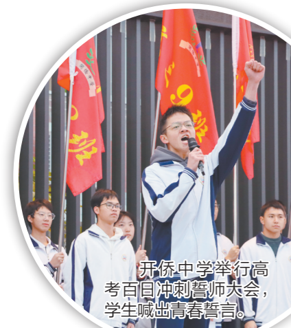
开侨中学举行高考百日冲刺誓师大会，学生喊出青春誓言。

江门日报讯（文/图 记者/胡涛 通讯员/伍斌 吴敏玲）近日，开平市多所高中举行高考百日冲刺誓师大会，激励高三学子奋力奔跑、全力冲刺，筑梦高考、圆梦六月。