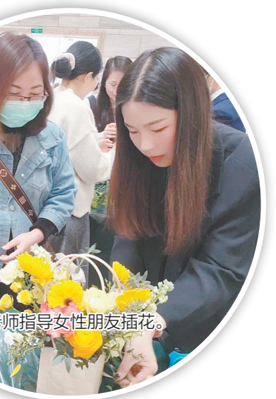
花艺老师指导女性朋友插花。

活动现场充满花香和欢声笑语，气氛轻松愉快，大家彼此交流插花心得，分享创作灵感，释放了压力，放松了心情。开平市博物馆作为AAA级旅游