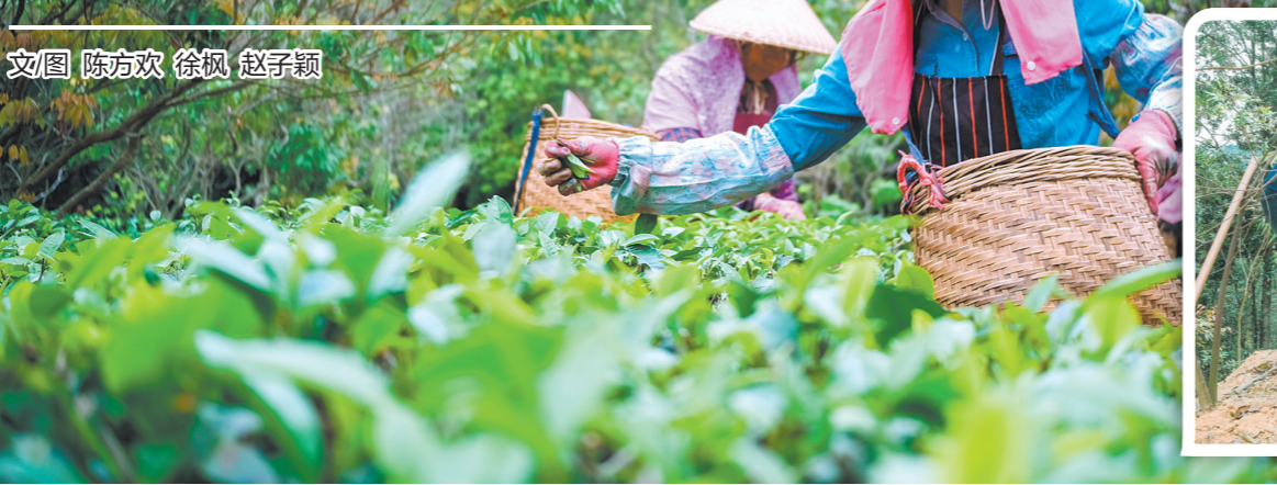
文图 陈方欢 徐枫 赵子颖