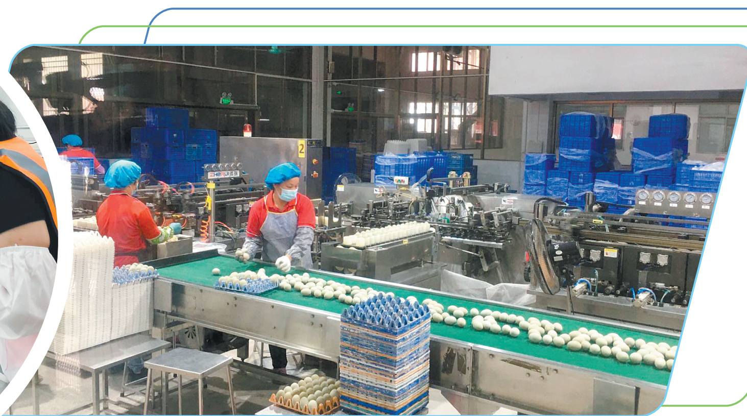
▲乘着“开平优品”东风,开平禽蛋行业快速发展。