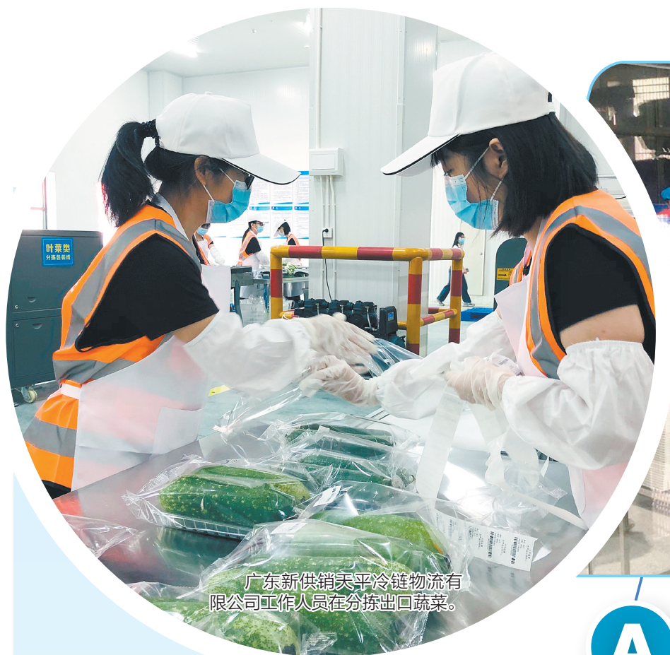
广东新供销天平冷链物流有限公司工作人员在分拣出口蔬菜。