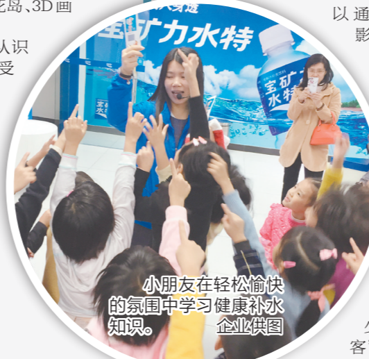
小朋友在轻松愉快的氛围中学习健康补水知识。