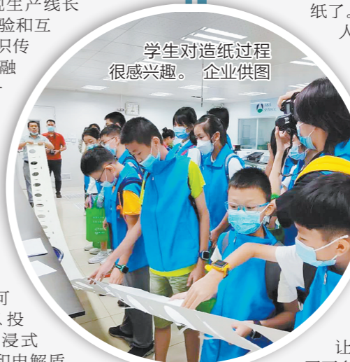
学生对造纸过程很感兴趣。

为鼓励社会多元主体广泛参与、深入挖掘和综合利用社会科普教育资源,提升科普公共服务质量,新会区每年都积极开展区级科普教育基地评选、认定工作,形成全社会关心、支持、参与科普工作的新局面,营造出有利于提升全民科学素质的良好社会氛围。