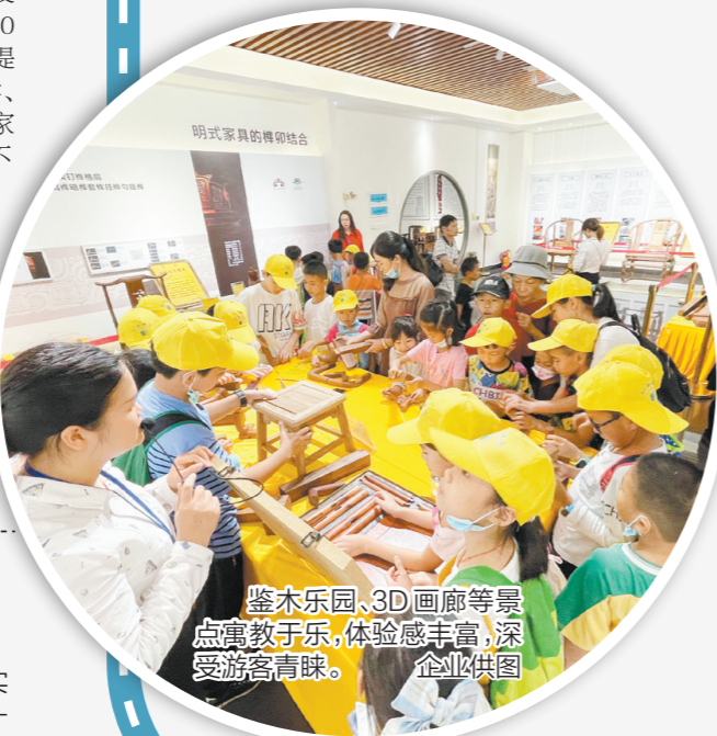
鉴木乐园、3D画廊等景点寓教于乐,体验感丰富,深受游客青睐。