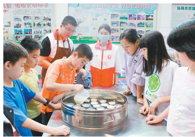
学生们在点心师傅的指导下动手制作点心，体验劳动的快乐。

“我们设计劳动实践课是想让学生们远离电子产品，学习劳动技能，亲身体验劳动带来的成就感和幸福感。”恩平市青少年活动中心相关负责人说。