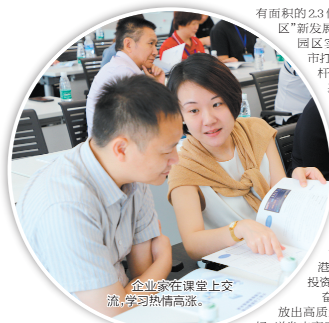
企业家在课堂上交流，学习热情高涨。

有面积的2.3倍，形成“一园四区”新发展格局，连片万亩园区实现梦想。恩平市打造珠三角特色标杆园区卓有成效，基础设施投资倍增行动扎实推进，恩平市职教园区、恩平创客谷等项目进场动工，恩平智造学院正式运营。今年第一季度，恩平市共引进项目35个，总投资178.8亿元（其中港资项目10个，总投资105亿元）。奋进中的恩平，释放出高质量发展的强烈磁场，迸发出高质量发展的动力、活力，展现出高质量发展的热烈氛围、升腾气象。奋进中的恩平，呼唤拥有“大视野”“大作为”“大情怀”的企业家。政企休戚与共，才能凝聚起高质量发展的最大合力。产学研的精准对接开启了科创与