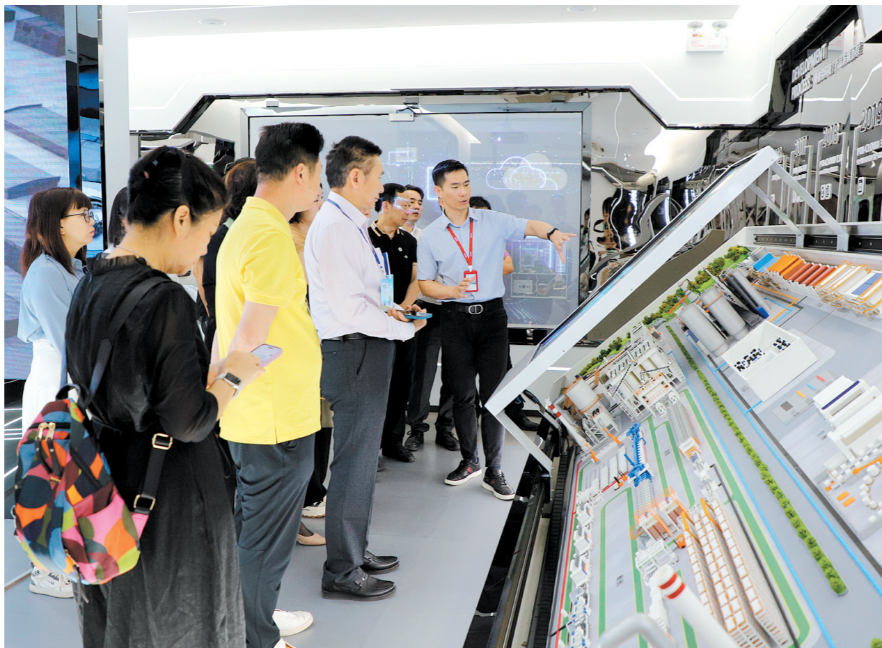
企业家到广州博依特智能信息科技有限公司、广汽集团参观学习。

据介绍，今年恩平市“工业振兴领航计划”将举办三期研修班。第二期的培训对象为“创二代”，第三期为职业经理人。“未来，我们将进一步总结经验，根据培训对象选择适合他们的高校和课程。第二期研修班已经在筹备中，预计5月举办。”该负责人说。