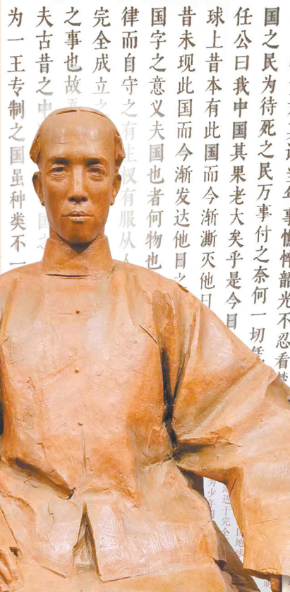
梁启超故居纪念馆内梁启超的新雕塑。