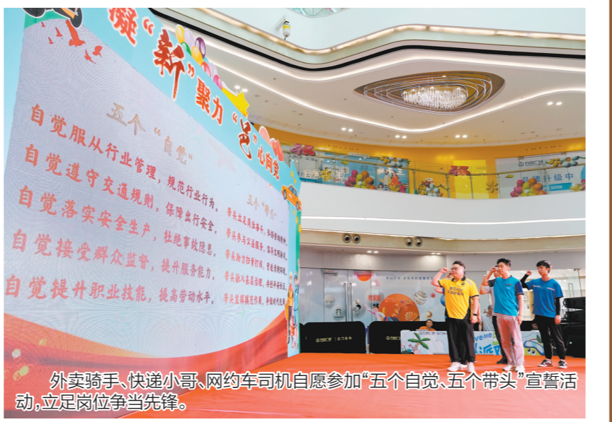
外卖骑手、快递小哥、网约车司机自愿参加“五个自觉、五个带头”宣誓活动,立足岗位争当先锋。

体式”新业态新就业群体权益保障中心,为大家提供更加全面贴心的权益服务;积极筹备技能学堂,为大家提供新媒体运营、开店经商等培训;开展