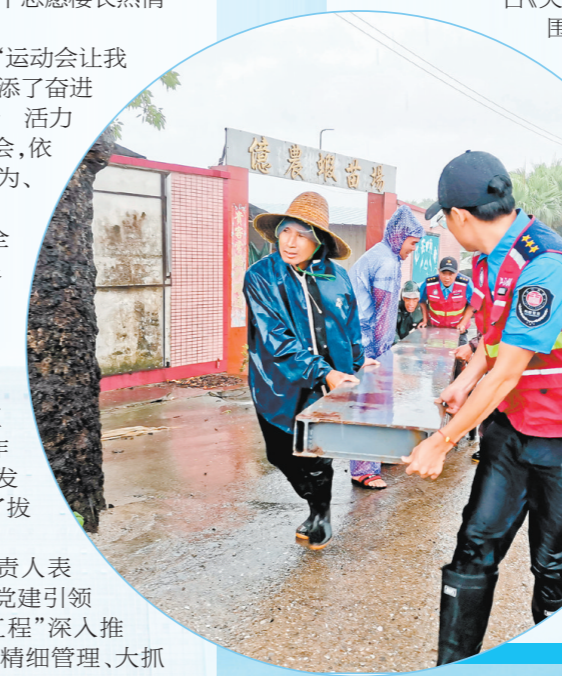
江门市深入践行党的二十大精神,根据全省城市基层党建引领基层治理工作会议部署,灵活采取单个社区举办、多个社区联合或整县统办等形式举办社区运动会,进一步增强党群关系、促进邻里和谐、共享治理成果。

市委组织部相关负责人表示,接下来,江门将继续把党建引领基层治理作为“书记工程”深入推进,坚持健全机制、精细管理、大抓基层、科技赋能、统筹推进,以高质量治理效能助推高质量发展。