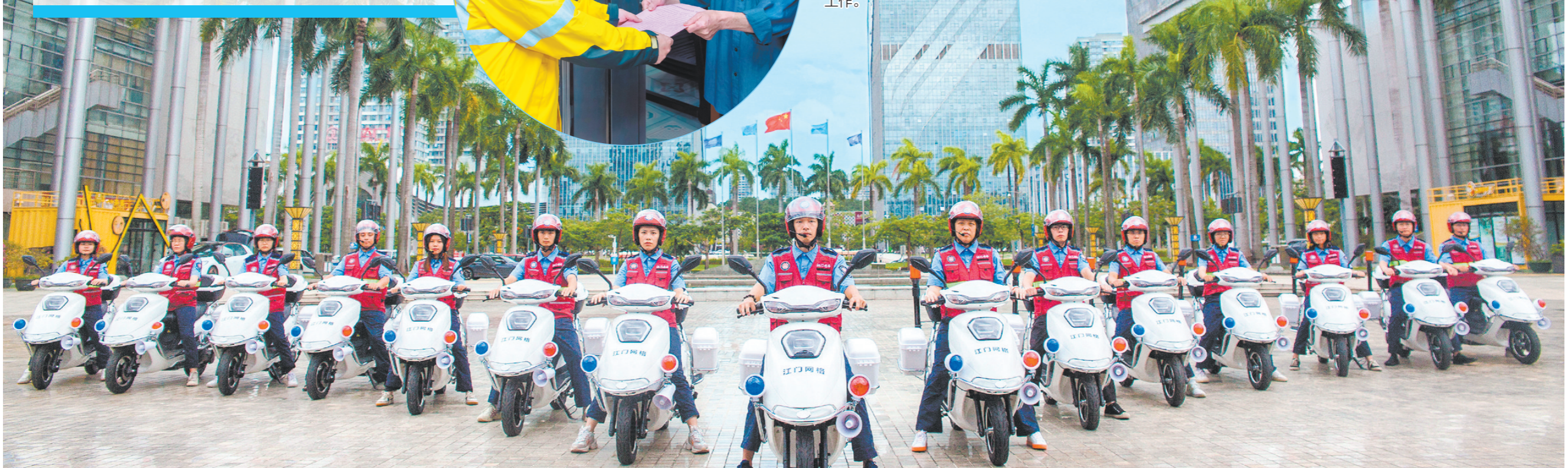
2022年,江门组建起专职智慧网格员队伍。图为江门智慧网格员整装待发。