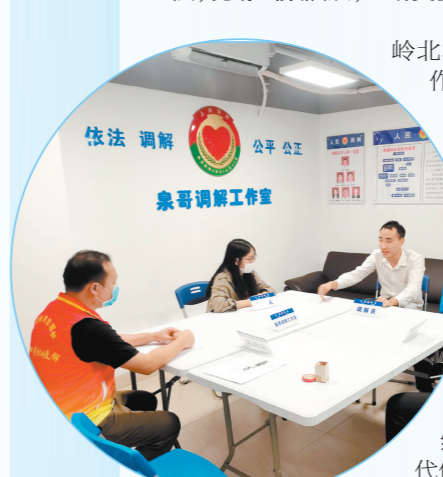
江门志愿楼长激活基层治理新“栋”能。图为志愿楼长在协助调解。

当前,江门高素质专业化干部不断涌现的生动局面加速形成,大家以“时不我待,只争朝夕”的精神大抓、快抓、狠抓各项工作,有力推动中央决策部署和省委工作部署、市委工作安排落地落实,以新担当新作为,推动江门高质量发展取得新成效。