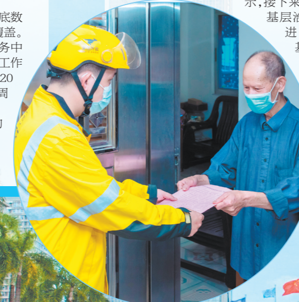
江门引导新就业群体人员到社区兼职网格员,让他们参与基层治理工作。