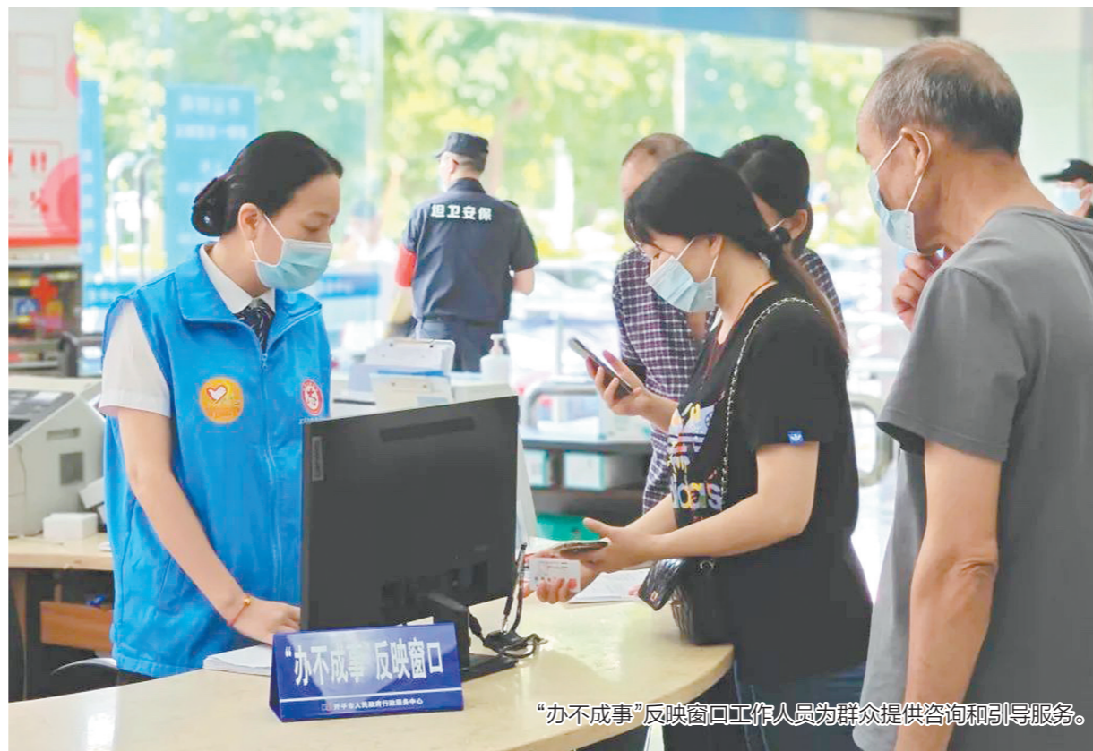
“办不成事”反映窗口工作人员为群众提供咨询和引导服务。

进行反映。 “‘办不成事’反映窗口通过受理登记、流转督办、反馈回访、归档备查四个工作流程,对企业、群众反映的疑难事项和复杂问题进行办理。”开平市行政服务中心相关负责人介绍,对于通过咨询、引导等能当场解决的,马上解决,让企业、群众即办即走;对于因缺材料办不了的,判断是否“容缺受理”,如不能现场受理则实行一次性告知,帮助企业、群众梳理材料清单;对于因政策或法律、机制等原因一时“办不了”的,向企业、群众说明情况、讲解政策,消除疑惑,并做好台账登记;对于需要多部门或多窗口并联审批等“很难办”的情况,积极协调,跟踪进度,并承诺1-3个工作日回复,保证疑问必答。 据统计,“办不成事”反映窗口自设立以来,累计现场协调解决咨询受理业务300余宗,受理“办不成事”反映问题10余宗,事项办结率和满意度均为100%,有效解决不动产“登记难”,推动“跨域通办、容缺受理”等工作进一步落实,政务服务质量持续提升。 民有所呼、民有所应,民有所盼、民有所办。据介绍,开平市行政服务中心将持续创新服务方式,推动流程优化,着力解决企业、群众“办不好”“办不全”的问题,全力提升企业、群众